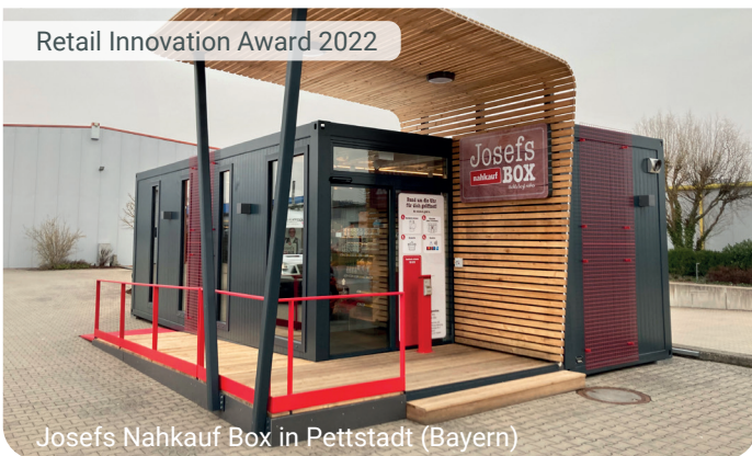
Josefs Nahkauf Box in Pettstadt (Bayern)