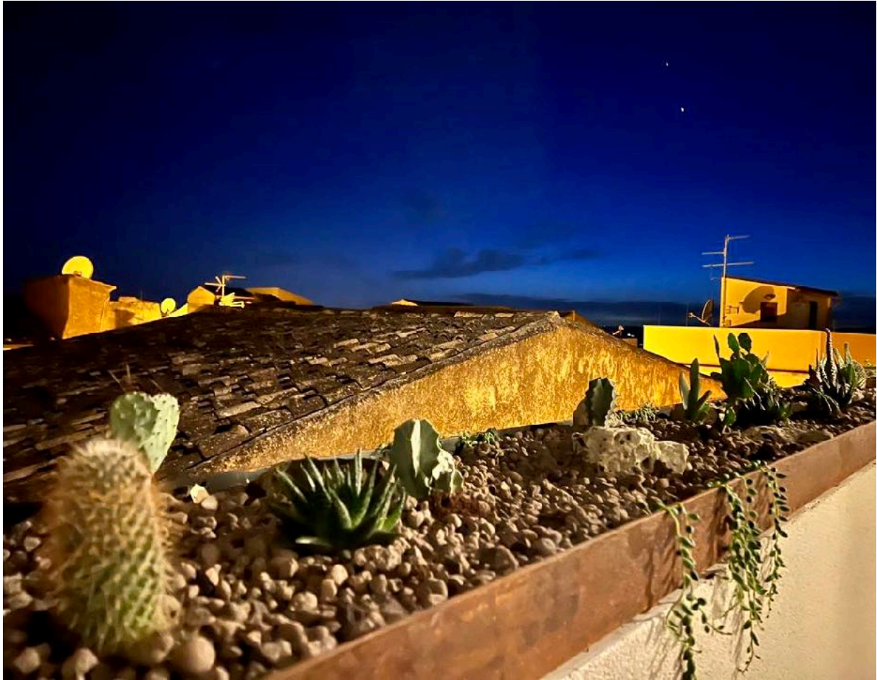
Uitzicht vanaf het terras van The Rooftop.