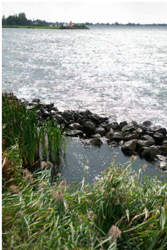
natuurvriendelijke oever Westeinderplassen

Naar aanleiding van deze rapporten en verschillende vergaderingen is met het