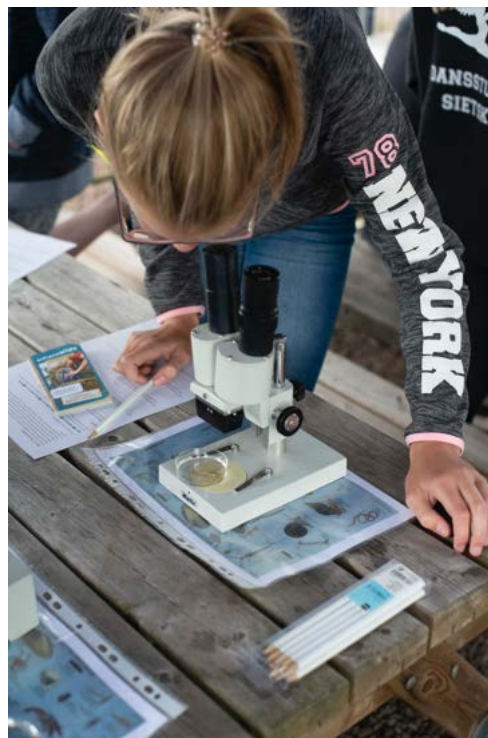
Waar zitten die grote kaken?

Op woensdag 26 juni 2019 verzorgde DGV voor drie groepen 8 van de Pijlstaart- en Jozefschool de inmiddels bekende waterlessen. In totaal kregen 59 leerlingen de gelegenheid iets te leren over de voedselpiramide, de kwaliteit en de helderheid van het Vinkeveense water en de dieren die daarin leven. Dat ging in drie keer drie groepen leerlingen die ook zelf aan de slag gingen. In kommen met water uit verschillende delen van Vinkeveen werd de waterkwaliteit gemeten en het onderscheid tussen de verschillende waterkwaliteiten uitgelegd. Duidelijk werd dat ook wat minder helder water goed van kwaliteit kan zijn voor het leven in het water. Onder binoculairs werd