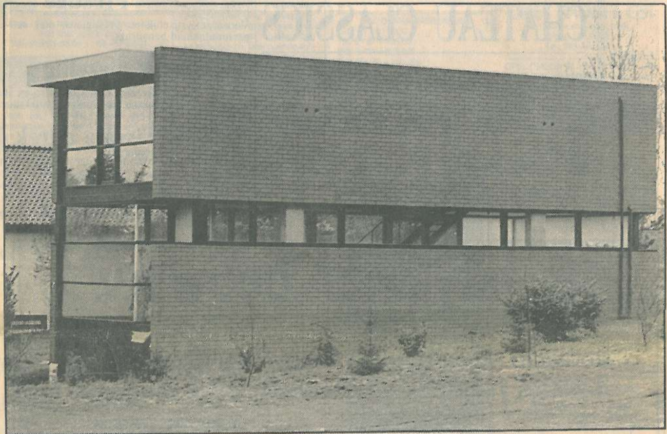
Woning Pijls. De transparantie en het contact met de natuur zitten als basisideeën vevat in het concept. De woning lijkt wel een open ruimte, ingesloten tussen twee glazen gevels. De ingreep is niets meer dan een snede in een prachtig golvend terrein.

meter hoge luifel, die een spanning creëert tussen de binnen- en buitenruimte.