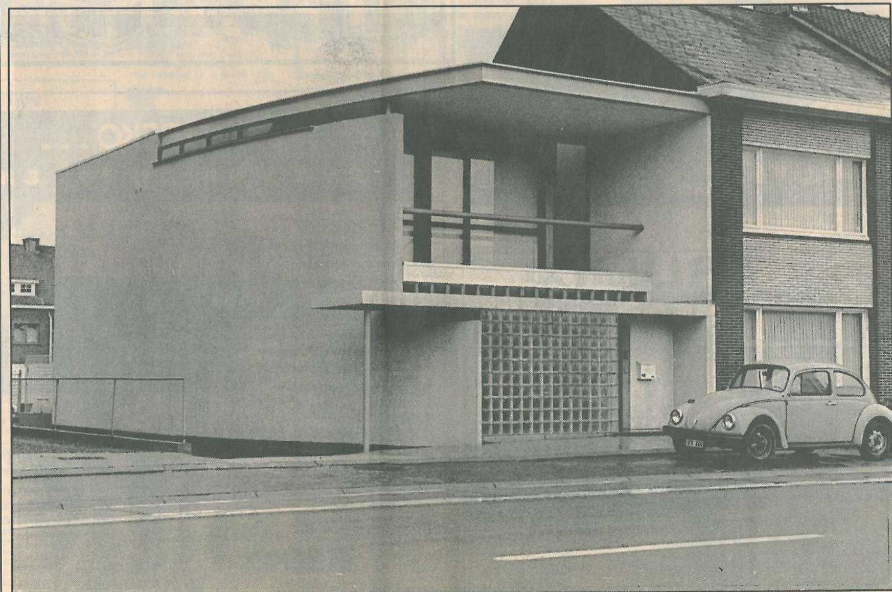
Woning Deconinck. Het project wordt gedragen door twee dynamische basiswanden, die elkaar kruisen en het geheel verankeren met de grond. Transparante en massieve vlakken, open en gesloten segmenten, creëren verschillende sfeermomenten. Deze woning fungeert door het gebruik van contrasterende kleuren tevens als blikwanger in het landschap.