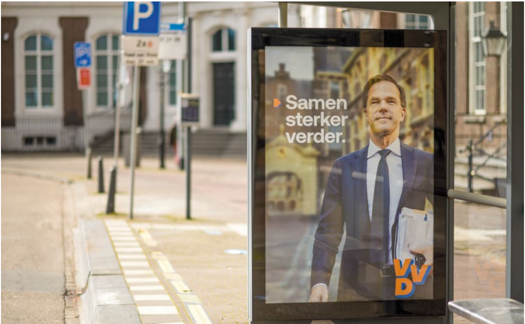
Campagne VVD | FotografiekB

De verkiezingsstrijd was lange tijd een strijd in en tussen het midden. Het CDA had een spilpositie en vaak stond de vraag centraal of CDA en VVD samen tot een meerderheid konden komen. Als dat niet zo was, dan was het CDA ‘veroordeeld’ tot een coalitie met de PvdA. Soms was daarbij sprake van veel tegenzin (het duidelijkst in 1981), soms iets minder (1989 en 2007), maar hartelijk en blijvend was de samenwerking nimmer. Vanaf 2002 waren vrijwel altijd drie partijen nodig voor een coalitie en in 2017 zelfs vier. 2012 was in dat opzicht de uitzondering. Ook nu is een brede coalitie (vier of zelfs vijf partijen) de bijna onvermijdelijke uitkomst, in elk geval als het om een meerderheidskabinet gaat.