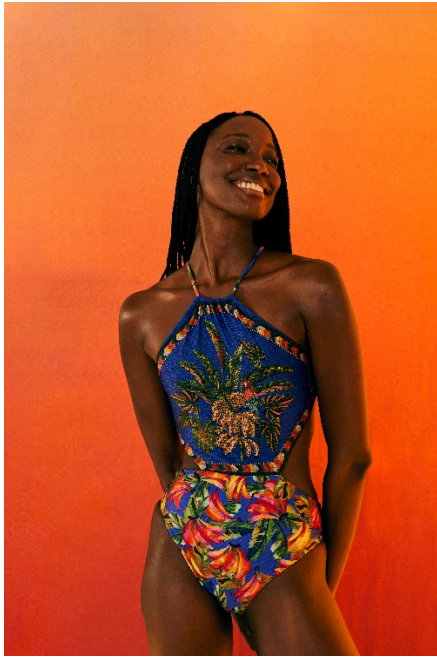
Farm Rio – Gewinner der Kategorie Colorful & Jolly