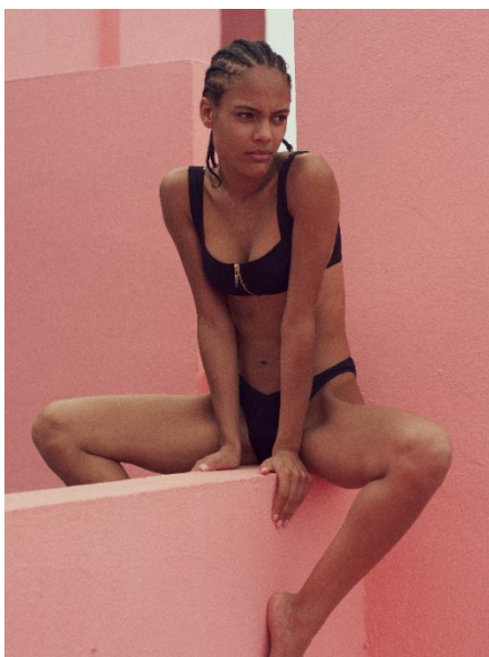
Livystone – Gewinner der Kategorie Newcomer