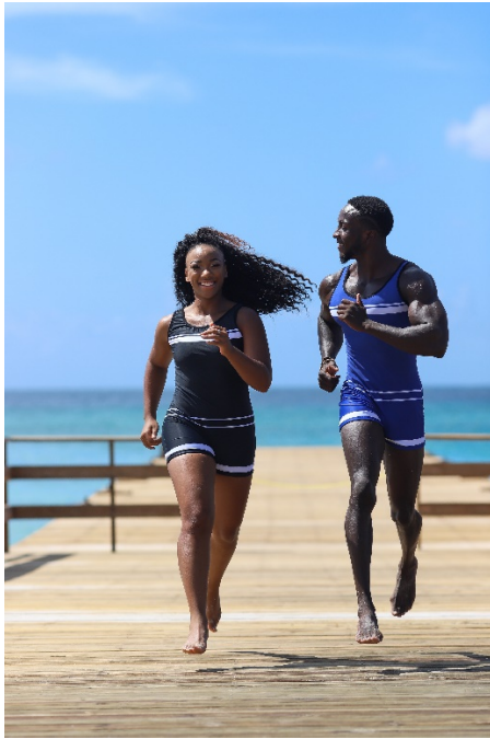
Beefcake Swimwear – Gewinner der Kategorie Retro