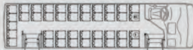
Modelo 95 CHASIS 1218/52 y 1221/52 EuroV