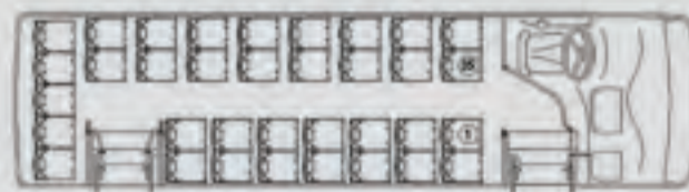
Modelo 84 CHASIS MB0-1018/44 EuroV