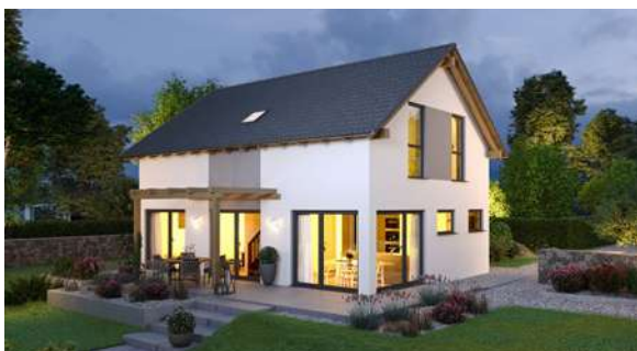
SCALA FAMILY123S MUSTERHAUS Graz (ab Frühjahr 2021)

Abbildungen enthalten Sonderausstattung. Preis ab Oberkante Bodenplatte/Kellerdecke.