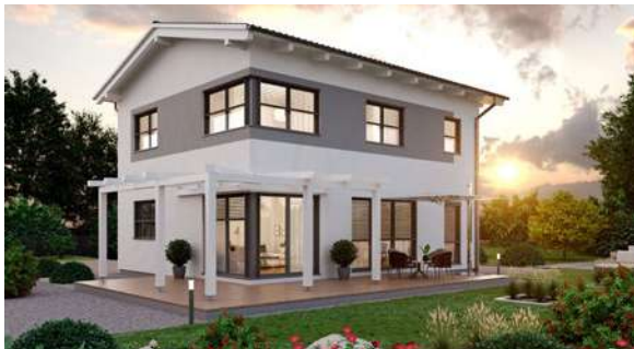
SCALA 126S MUSTERHAUS Eugendorf

Nichts gibt mehr Sicherheit: Sieh, teste und spüre die SCALA Haus Qualität in unseren Musterhäusern: