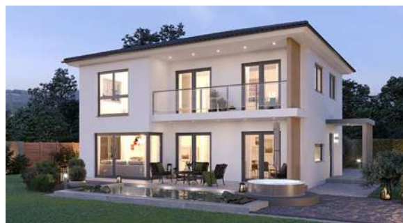
SCALA 136W MUSTERHAUS Blaue Lagune

Abbildungen enthalten Sonderausstattung. Preis ab Oberkante Bodenplatte/Kellerdecke.