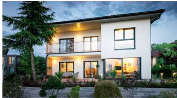
SCALA 144W MUSTERHAUS Eugendorf