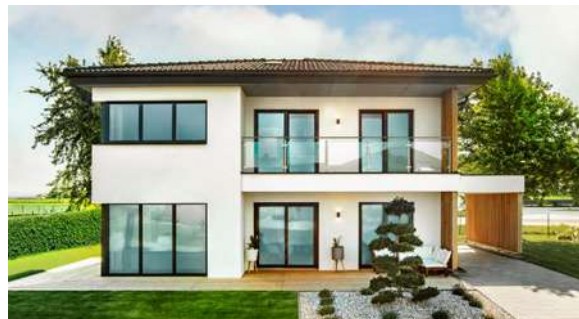
SCALA 137W MUSTERHAUS Haid