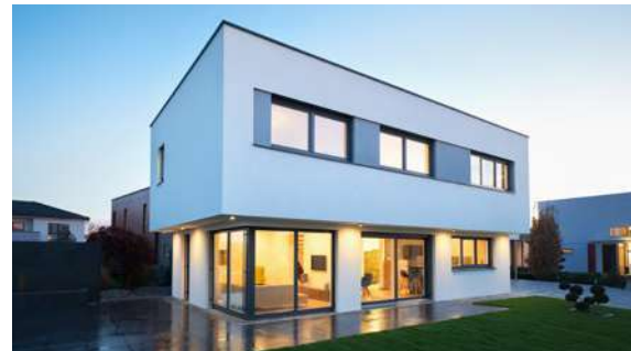
SCALA 160F MUSTERHAUS Haid