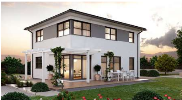
SCALA 126W MUSTERHAUS Haid