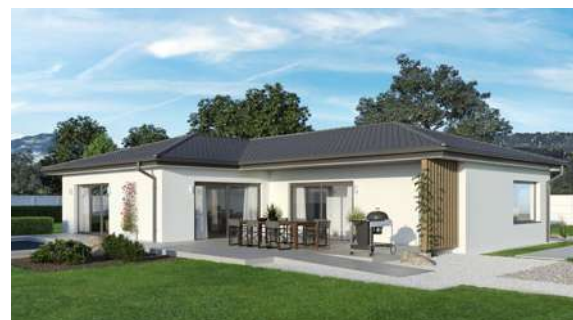
SCALA B135W MUSTERHAUS Blaue Lagune

MUSTERHAUSPARK EUGENDORF Musterhauspark 23 5301 Eugendorf Tel.: +43 660 199 53 60 eugendorf@scalahaus.at