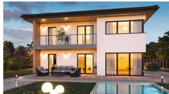
SCALA 128W MUSTERHAUS Graz