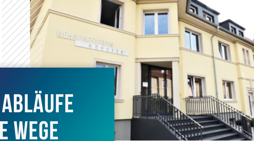
Der Wohnungsverein Münster eG wurde 1893 gegründet.