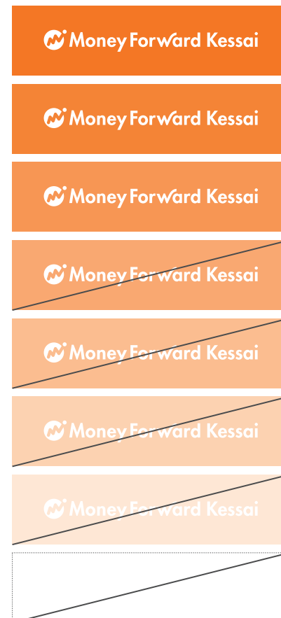
カラー：ネガティブ表示