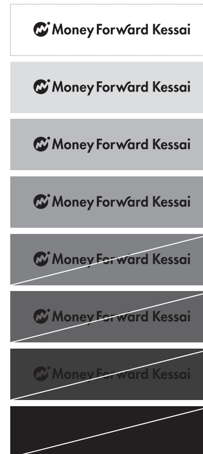
モノクロ：ポジティブ表示