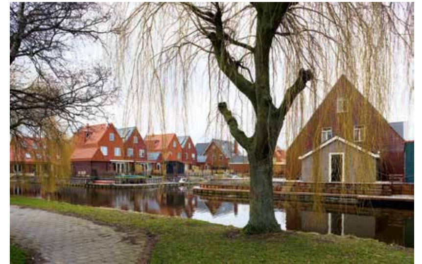
Een van de vele woonwijken die SVP ontwierp: Twuyverhoek in het dorp Sint Pancras.

Het gesprek komt op de voortdurende discussie of we wel of niet buiten de stad moeten bouwen. Vlaswinkel: 'Het is niet het een of het ander. Wij vinden dat uitbreiden, en dus bouwen in het landschap, moet kunnen in gebieden waar de vraag naar woningen hoog is. Maar dan wel op een manier die niet op veel andere plekken al te vinden is.' Luisman: 'We krijgen nog regelmatig verzoeken waarbij het programma van eisen steeds hetzelfde is – altijd een niksigse dichtheid, altijd dezelfde typen