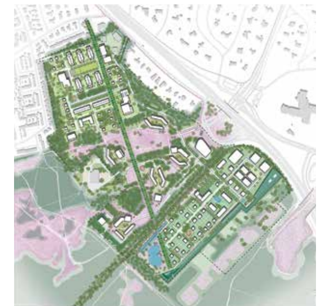
Landschappelijk wonen anno 2021: buurtschap Crailo tussen Hilversum, Bussum en Laren.