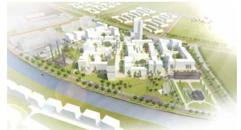
SVP maakte het stedenbouwkundig plan voor de herontwikkeling van een voormalig defensie terrein in Utrecht.