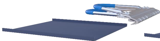
Blechbahn vorbereitet UniBieger in Position