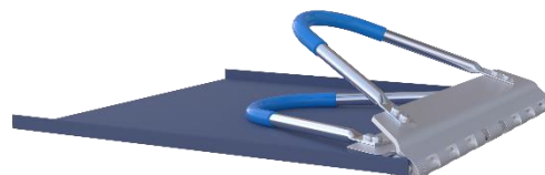
Blechbahn geklemmt Schritt 2