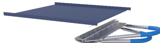
UniBieger von der Blechbahn gelöst

BLZ: 20815 IBAN: AT23 2081 5046 0141 0741 BIC: STSPAT2GXXX