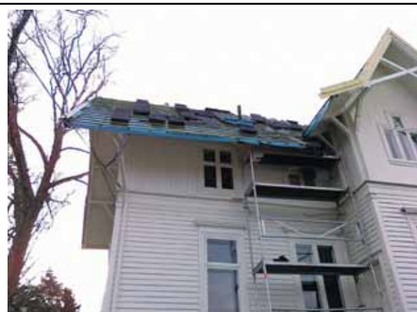
«Et eksempel på godt sikringarbeid ved takarbeid.»