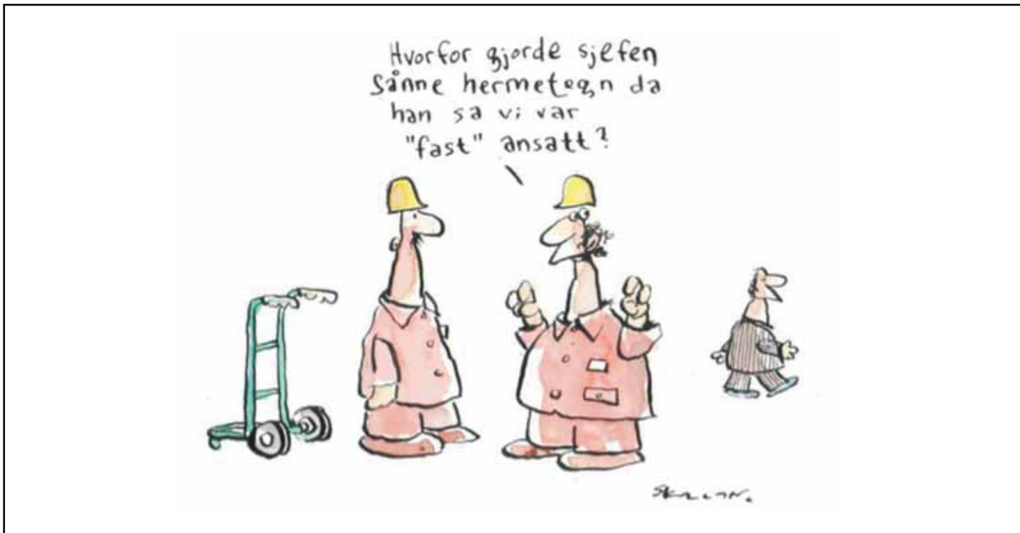
Tegningen er gjengitt med tillatelse fra Fredrik Skavlan

Harald Berntsen er historiker. Han har skrevet en rekke bøker, bl. a. Norsk Bygningsindustriarbeiderforbunds historie. Han har nylig fullført hotell- og restaurantarbeidernes historie. Harald er i tillegg en ivrig debattant.