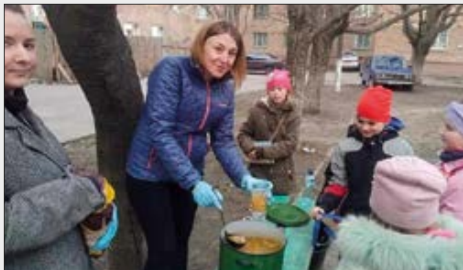
Utdeling av mat og klær til innesperrede byer ved frontlinjen.

Open Heart har fått særskilt tillatelse til å komme inn med mat, klær og gaver til folk som nå er innesperret i byer langs krigens frontlinje.