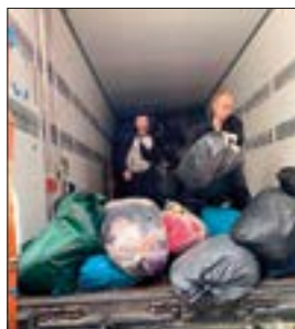
Trailerne med klær og nødhjelp fra Bømlo har allerede kommet fram til Ukraina, der mennesker venter på livsviktig hjelp.

Byen Lastochkino i Donetsk-regionen ligger også rett ved krigsfronten. Her bor utslitte mennesker som drømmer om et liv uten krig. De er fanget i en endeløs hverdag av uvitenhet, og mangel på håp for fremtiden. Da Open Hearts frivillige kom med hjelp var det mange som gråt av takknemlighet.