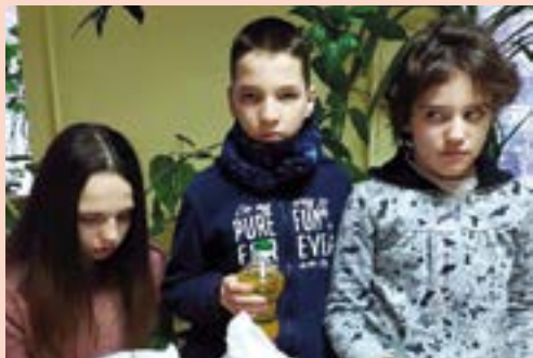
De tre søsknene Gordienko i Kiev måtte tigge naboene om mat, før Open Heart fant dem.