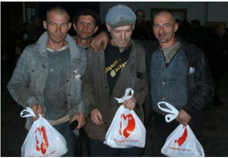
Takknemlige fanger har fått mat og klær. Det er hjerteskjærende å besøke fengslene i Ukraina. I fengslene i krigsområdene er fangene totalt glemt av omgivelsene, utsultede og desperate. Open Heart har vært der med mat og evangeliet.