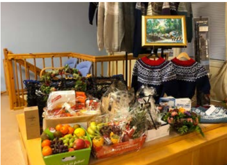
Fra en av de lokale innsamlingene i Norge som gjør Open Hearts arbeid mulig!