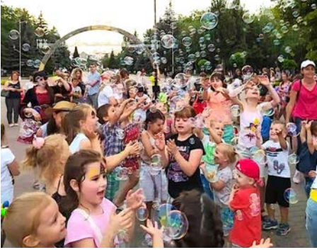
Overlykkelige barn får julegaver fra Open Heart. Gleden de uttrykker er det sterkt å være vitne til.