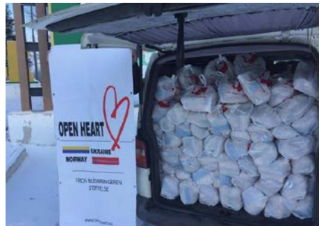
Open Hearts bil har ankommet landsbyen med mat og klær.