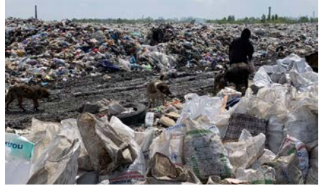
Desperate ukrainere leter etter mat blant nyan-kommet søppel.