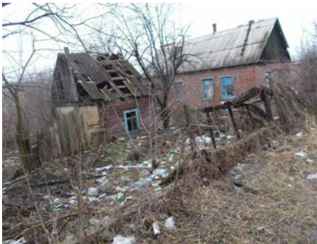
Mange bor under uverdige forhold i ødelagte hus. Om vinteren kryper kulde inn.