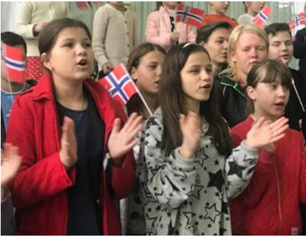
Barn som har fått et helt nytt liv gjennom fra Open Heart, opptrer på et arrangement for open Hearts givere,.