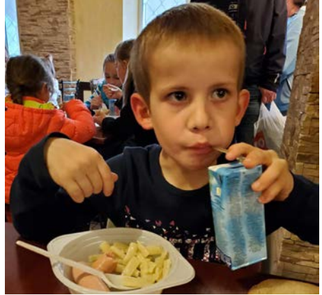
Sultne barn får mat på en av Open Hearts suppestasjoner.