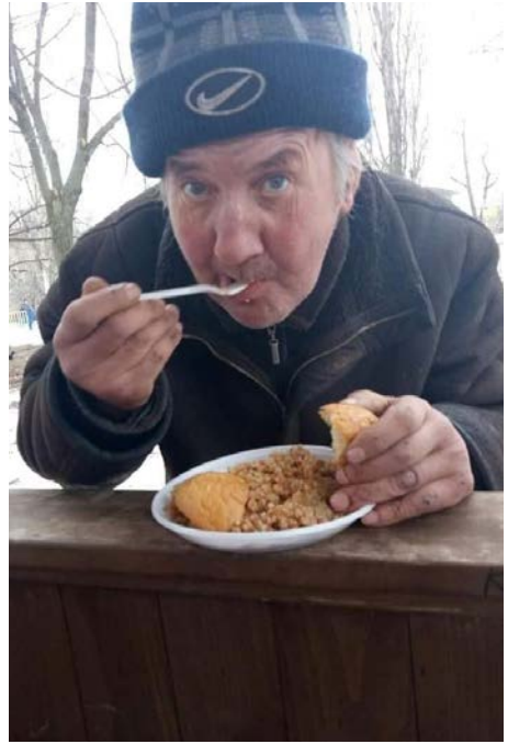
En sulten uteligger har fått varm mat av Open Heart.

Du får skattefritak for gaver du gir til Open Heart. Dersom du ønsker skattefritak for dine gaver må vi få oppgitt ditt personnummer. Personnummeret sammen med giverbeløpet blir oversendt skatteetaten og du får dette beløpet ført opp på skattemeldingen. Husk at skattefradragsordningen er beløp pr person inntil kr 50.000, –Ta kontakt på mail bv@openheart.no eller mobil 900 26 290