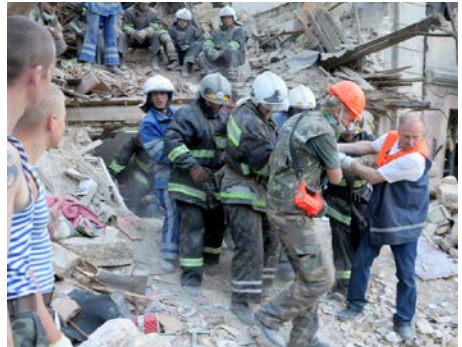
En redningsaksjon etter et bombeangrep i krigs-områdene. Barna får varige traumer etter å være vitne til fryktelige hendelser.

har opplevd hjerteskjærende tragedier i alt for ung alder. En jente hadde sett sine foreldre bli skutt og drept, mens en annen fant vi i et hus som var truffet av en bombe. Huset var knust og hun satt selv lamslått ved sin far side. Han hadde fått begge beina avrevet. Siden den dagen har hun verken snakket eller smilt. Hjertene våre blør for disse menneskene, og din gave går uavkortet til de som trenger det mest.