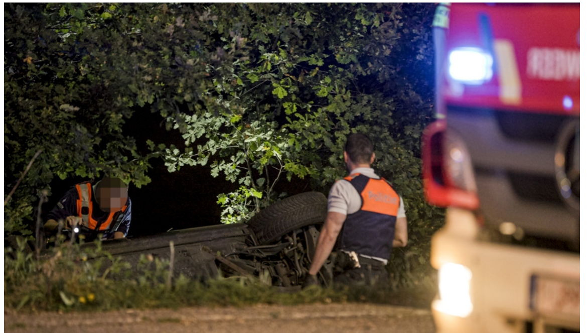
De auto kwam in een gracht terecht en crashte tegen een duiker.

De familie zit intussen met veel vragen. De wegenwerken op de Universiteitslaan zouden volgens hen een impact hebben gehad op