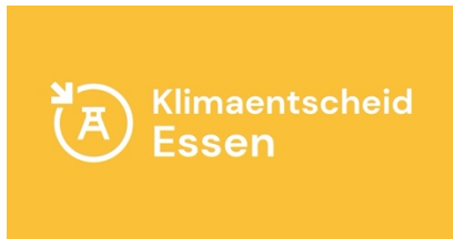
Abb. 2: Lokales Logo im GZ-Design

Mit einem eigenen Logo repräsentiert ihr prägnant eure Kommune und euren Klimaentscheid und zeigt zugleich, dass ihr Teil der bundesweiten Klimaentscheid-Bewegung seid. Wir bieten euch daher an, ein lokal angepasstes Klimaentscheid-Logo im GermanZero-Design zu erstellen. Das hier ist beispielsweise das Logo des Klimaentscheides Essen: