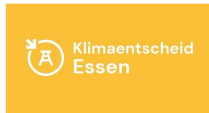
Abb. 2: Lokales Logo im GZ-Design

Mit einem eigenen Logo repräsentiert ihr prägnant eure Kommune und euren Klimaentscheid und zeigt zugleich, dass ihr Teil der bundesweiten Klimaentscheide-Bewegung seid. Wir bieten euch daher an, ein lokal angepasstes Klimaentscheid-Logo im GermanZero-Design zu erstellen. Das hier ist beispielsweise das Logo des Klimaentscheides Essen: