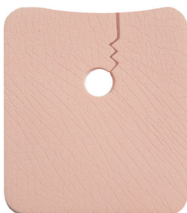
REF 958 (groß)