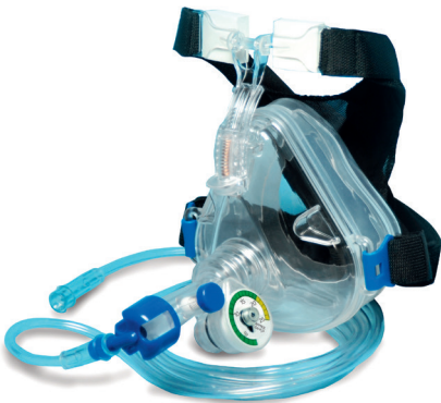
Flow-Safe II mit Deluxe-Maske

Komplett verpackte Sets zum schnellen und einfachen Einsatz zur CPAP-Therapie – auch mit integriertem Vernebler (Flow-Safe II EZ). Das System ist mit geringem apparativen Aufwand anwendbar und mit dem Anschluss an eine Gasquelle einsatzbereit. Einstellung des PEEP erfolgt über die Gasdurchflussrate.