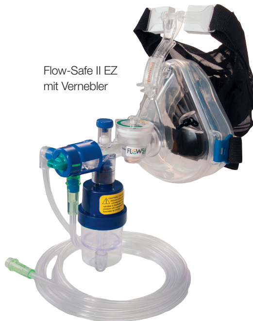
Flow-Safe II EZ mit Vernebler