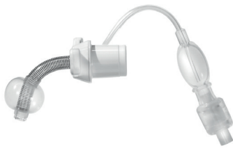
REF 372 mit H 2 O Cuff