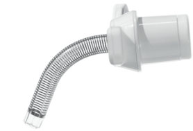
REF 370 ohne H 2 O Cuff