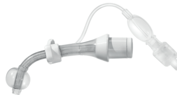
REF 373 mit H 2 O Cuff, proximal länger