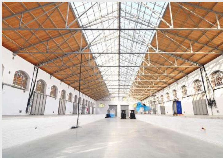
Entrepôt douanier Essen