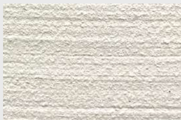
RC Chaulage standard

RC Chaulage F a les mêmes propriétés que RC Chaulage mais est fourni en sacs de 23 kg au lieu de 25 kg.