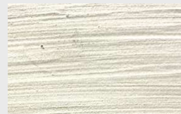
RC Chaulage Fin