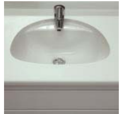
Kunststoffbeschichtete Arbeitsplatte mit fugenlos eingebautem Unterbau-Keramikbecken.