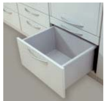
Auszugsfront mit Kniekontakt, Abfallbehälter