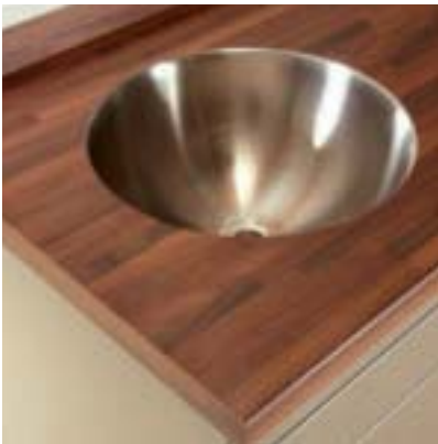
Arbeitsplatte Holz/Kunststoff mit Unterbaubecken aus mattem Edelstahl.

Hygiene ist die Grundvoraussetzung jeglicher Arbeit in Klinik, Praxis oder Labor. Dazu gehören vor allem auch Wascheinrichtungen und Arbeitsplatten. Mediadent hat eine Vielzahl von Arbeitsplatten im Programm, die sich alle durch leichte Reinigung und hohe Belastbarkeit auszeichnen. Das Schöne daran: Trotz dieser wichtigen Aufgaben dürfen sie auch ästhetische Ansprüche erfüllen!