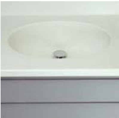
Corian-Waschbecken mit Corianplatte (Mineralstein) fugenlos verbunden.