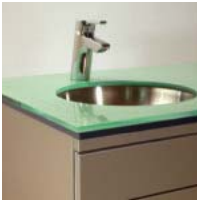
Glasplatte mit Unterbaubecken aus mattem Edelstahl.