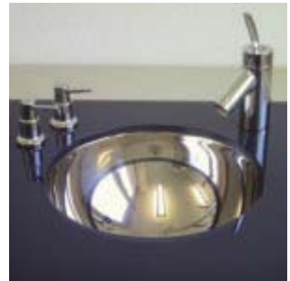
Glasplatte mit Unterbaubecken aus poliertem Edelstahl.