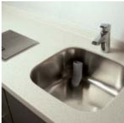
Einbau-Mischgerät und Edelstahl-Unterbaubecken in Mineralstein-Arbeitsplatte eingebaut.