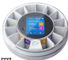
一个或多个药剂翻转装置