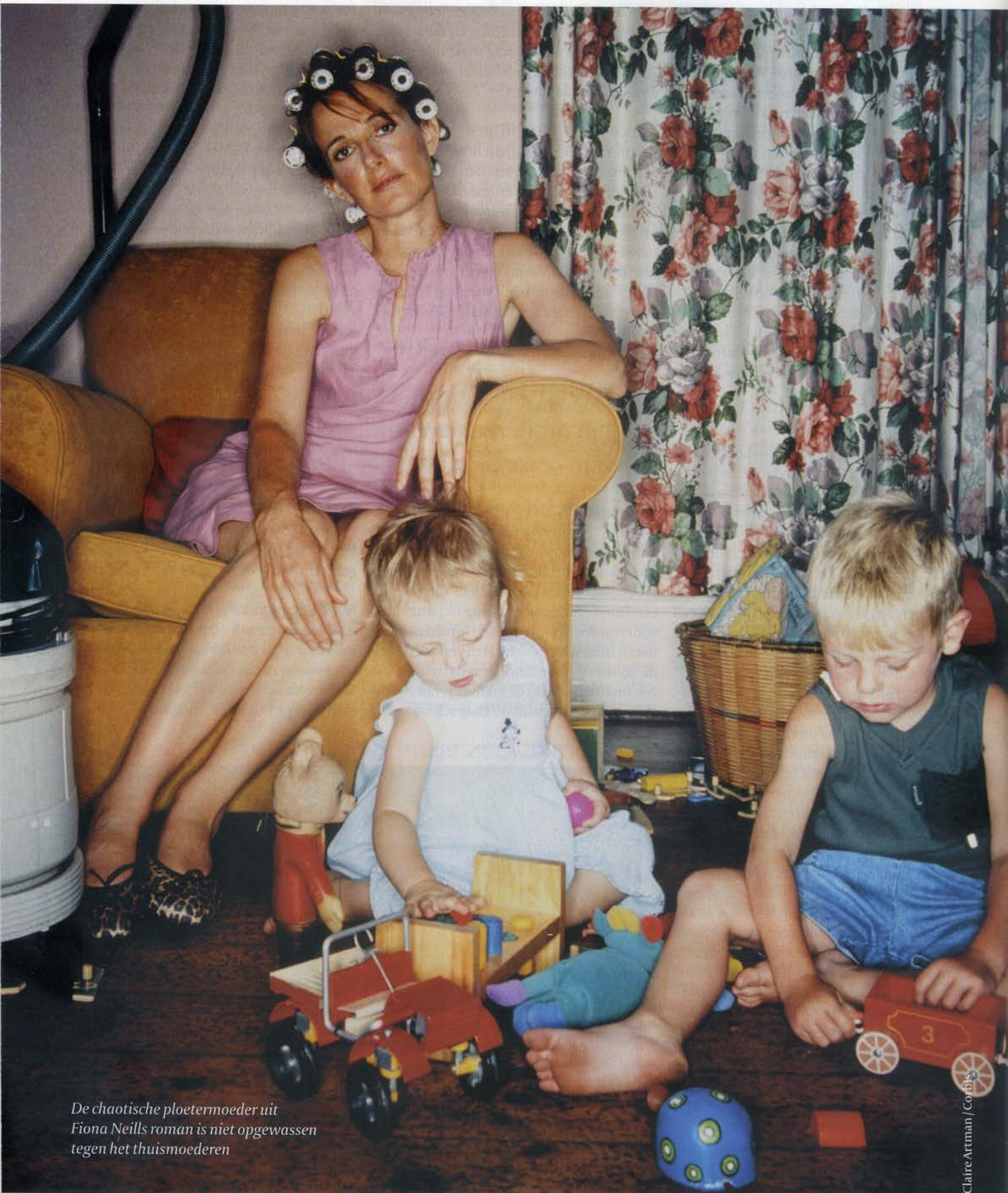
De chaotische ploetermoeder uit Fiona Neills roman is niet opgewassen tegen het thuismoederen