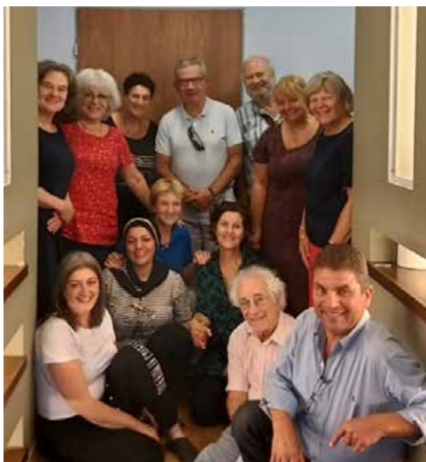
המשלחת ההולנדית בביקור במרכז הסיוע בכפר כנא במסגרת אירועי אלה 40

בשנת הפעילות התקיימו 34 קבוצות תמיכה ברחבי הארץ לאנשים שאבדו את יקיריהם כתוצאה מרצח, התאבדות או תאונת דרכים. בין הקבוצות היו קבוצות תמיכה להורים, לאחים, לילדים ולבני זוג. הוקמה גם תכנית של מפגשים חד פעמיים במתכונת של בית פתוח, בכל מפגש הוזמן מנחה שהעביר פעילות בנושא הקשור להתמודדות עם אבדן ושכול. 297 אנשים השתתפו בקבוצות התמיכה. ניכר כי ההשתתפות בקבוצות עוזרת מאוד לבני משפחה ללמוד לחיות, בכל מובן המילה, לצד הכאב ולא להיכנע ליגון.