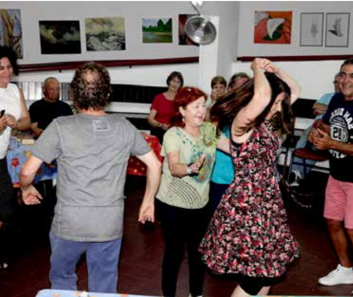
Op de dansvloer van Hutspot Hadera

In de loop der jaren heeft Elah een grote diversiteit aan therapeutische en sociaal-culturele activiteiten ontwikkeld, die apart of gecombineerd kunnen worden ingezet ten bate van individuen en groepen.