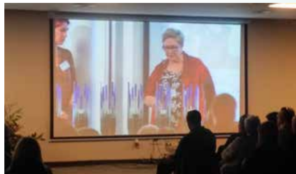
Op de herdenking steken zes nabestaanden een kaars aan