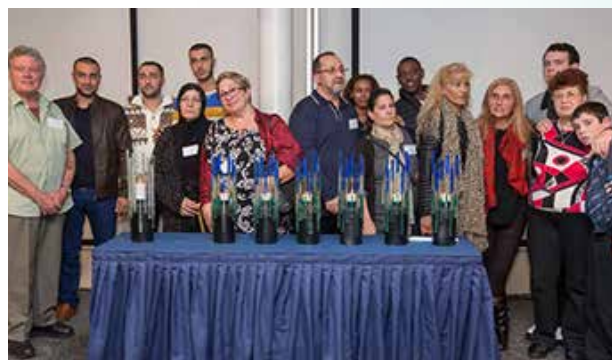
De kaarsaanstekers van 2015 en hun familieleden