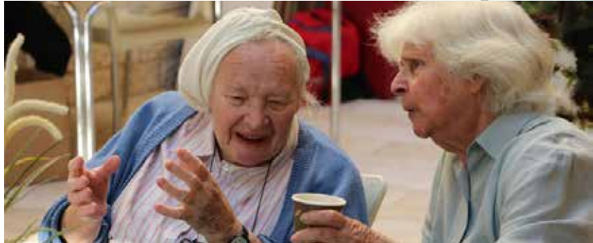
In de groepen voor ouderen ontstaan soms sterke banden

Elah geeft lezingen en workshops aan ouderen en Sjoa-overlevenden over uiteenlopende onderwerpen als dromen, humor, omgaan met boosheid, de betekenis van geheimen in ons leven, discriminatie en vooroordelen, grootouderschap in de modern tijd etc. Op uitnodiging van de welzijnsafdeling van diverse gemeentes gaven therapeuten van Elah dit jaar 43 lezingen en workshops voor 733 ouderen. In totaal was er sprake van 2390 uur activiteit.