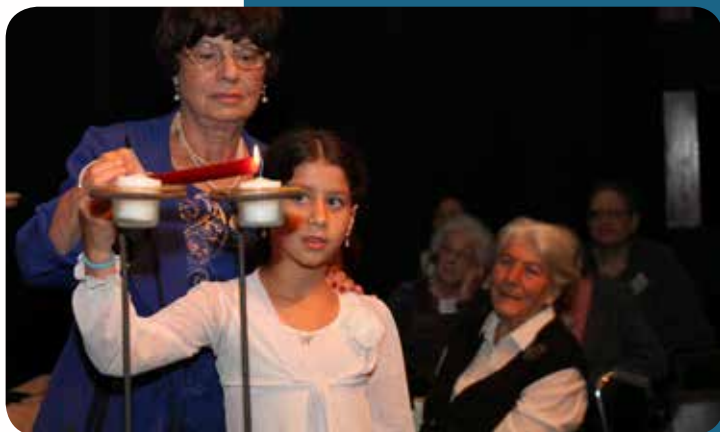
Op Jom HaSjoa steken zes overlevenden een herdenkingskaars aan