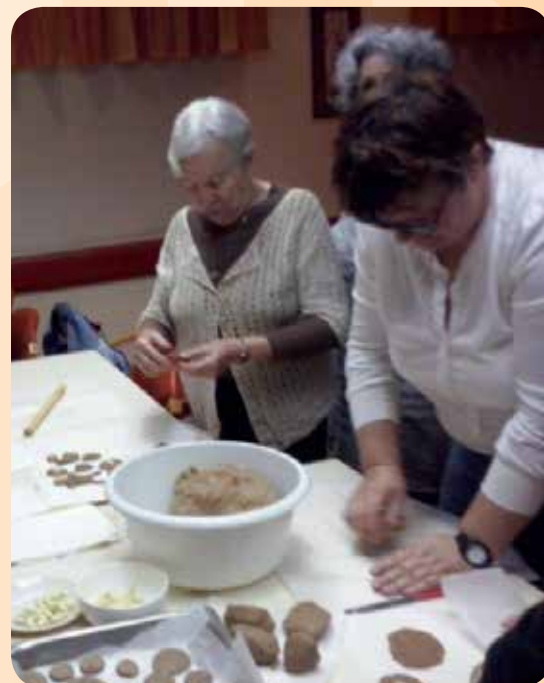
Speculaas bakken bij Hutspot Hadera

In alle regio's van het land organiseren onze opbouwwerkers samen met vrijwilligers bijeenkomsten voor leeftijdsgebonden groepen waarvan de leden eenzelfde culturele achtergrond hebben. De bijeenkomsten geven de deelnemers de gelegenheid om contacten op te bouwen. In 2013 zijn in het hele land 9 sociale groepen actief geweest. Vijf groepen werden georganiseerd in samenwerking met de Nederlandse immigrantenorganisatie (Irgoen Olei Holland). Er namen in totaal 237 mensen deel aan de groepen.