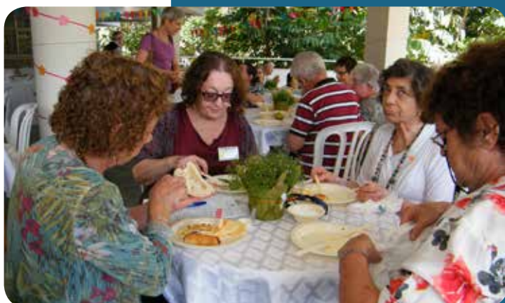
Gezellig lunchen op de Maatjesdag