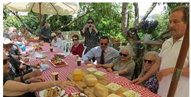
הקמטוטים, קבוצה לבני 80 פלוס במרכז הארץ, מבקרים במפעל הגבינות של ריינאודן ון חיקנקל, בנוכחות שגריר הולנד קספר פלדקאמפ

'אלה' עובדת באופן תמידי על איתור מקורות מימון רווחניים בהולנד. דרך עמותת החברים בהולנד נעשו ב-2015 פעולות גיוס המשאבים כגון: ניהול קשרים עם תורמים פרטיים על ידי שליחת ניזולטר דיגיטלי, מכתבים, ניהול דף פייסבוק וניהול קשר עם הועדה המייעצת; פרסום מאמרים בעיתונות היהודית והמקצועית; איוש דוכנים בכנסים לאוהדי ישראל על ידי מתנדבים ומתן הרצאות לקבוצות תיירים המגיעות לארץ.