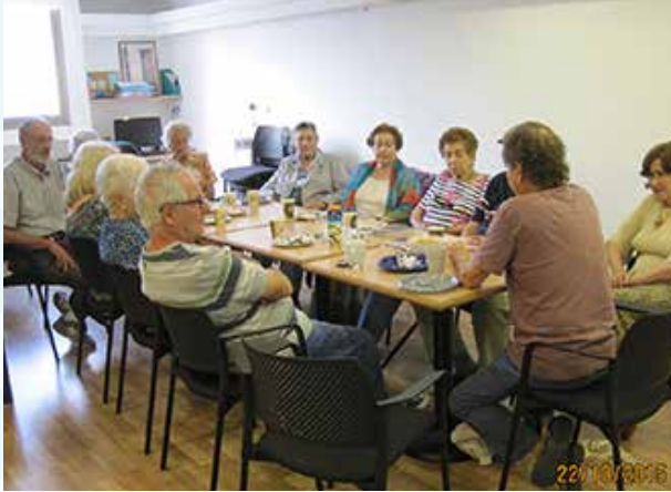
המתנדבים של 'אלה' פועלים תחת הדרכה מקצועית

במשך השנים פיתחה 'אלה' מקבץ של שירותי סיוע נפשיים וחברתיים שניתן לשלב או להתאים בקלות לצרכים של כל פרט או קבוצה.