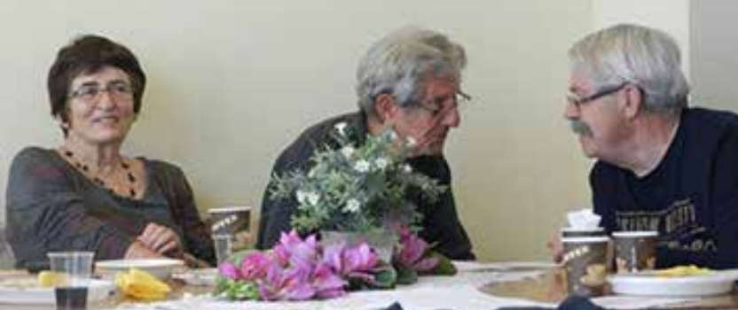
בקבוצות נוצרים לעיתים קשרים עמוקים מאוד

בסך הכל קיבלו כמעט 2,000 אנשים יותר מ-12,000 שעות שירות במסגרת זו.