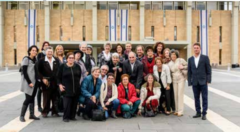
מתנדבים וחברי צוות 'אלה' ברחבת הכנסת

ב-2015 קיבלו יותר מ-500 אנשי מקצוע, סטודנטים ומתנדבים מארגונים אחרים יותר מ-1,200 שעות הדרכה והעברת ידע מטעם 'אלה'.