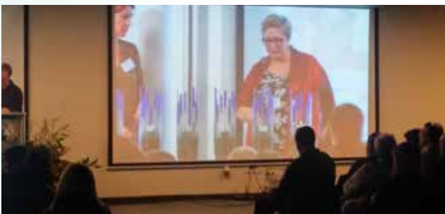
בטקס הזיכרון הדליקו שש משפחות נרות לזכר יקיריהן

ב-20 בדצמבר 2015 ארגנה 'אלה' בפעם השלישית טקס זיכרון 'לא שוכחים אף אחד' בשיתוף פעולה עם משרד הרווחה, משרד המשפטים, משרתת ישראל, וארגון משפחות נרצחים ונרצחות, לזכרם של כל הנרצחים והנרצחות בארץ, במטרה לתת ביטוי והכרה פומבית לאובדן היקרים, לסבל ולשכול הייחודי אשר חוות המשפחות. במעמד זה ניסו לשבור את מחסום האטימות והשתיקה של הציבור, שאינו מעוניין לשמוע ולהתעמק בתופעה חברתית זו של מקרי רצח נוראיים. בטקס נדלקו שבע נרות זיכרון ושמענו את סיפורו האישי של שבע משפחות מכל קשת האוכלוסייה הישראלית, ששקפו את המרקם החברתי וייצגו מקרי רצח שונים. כ-400 אנשים השתתפו בטקס, ובאו נציגים של משרד הרווחה, משרד המשפטים ומשרתת ישראל. הטקס התקיים בגני התערוכה בתל אביב. ראש האופוזיציה בוז'י הרצוג, שהקים את התכנית, היה נוכח בטקס ונשא דברים.