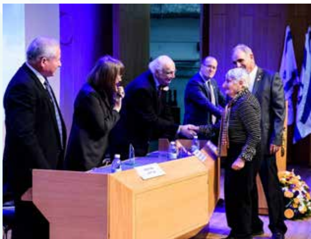
בטקס 'עיתור האור' בכנסת, איני לדרר ועמוס ון ראלטה מקבלים את העיטור בשם כל מתנדבי 'אלה'