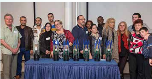
שש המשפחות של מדליקי הנרות בטקס 2015