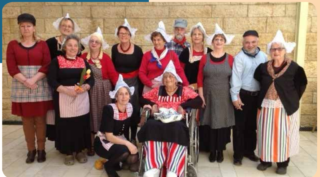
דיירי בית בארט מחופשים בפורים

'אלה' עובדת באופן תמידי על איתור מקורות מימון רלוונטיים בהולנד. במסגרת זו נעשו ב-2013 מאמצים להפעיל מחדש את העמותה ההולנדית למען גיוס המשאבים ל'אלה' בישראל. בין יתר פעולות הגיוס, הוקם חוג יידיים מאנשים אמידים ומוכרים מעולם הפוליטיקה והעסקים בהולנד. בנוסף, הצלחנו לאייש ועד פעיל בהולנד ומספר מתנדבים הפועלים למען העמותה.