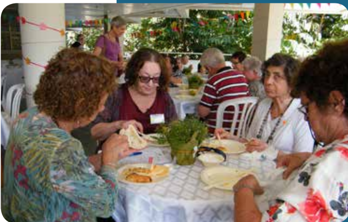
אוכלים צהריים יחדיו ביום המתנדב