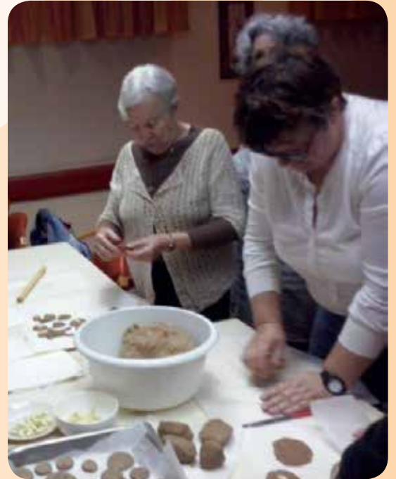
אופים עוגיות בקדירה בחדרה

באזורים שונים בארץ, מארגנים עובדים קהילתיים של 'אלה', יחד עם צוות מתנדבים, פעילויות לאנשים מקבוצות גיל ורקע דומה. דרך קבוצות אלו, מקבלים המשתתפים אפשרות להכיר אנשים חדשים וליצור קשרים. בשנת 2013 פעלו תשע קבוצות חברתיות ליוצאי הולנד ברחבי הארץ. חמש קבוצות התארגנו בשיתוף פעולה עם ארגון עולי הולנד. 237 אנשים השתתפו בקבוצות החברתיות.