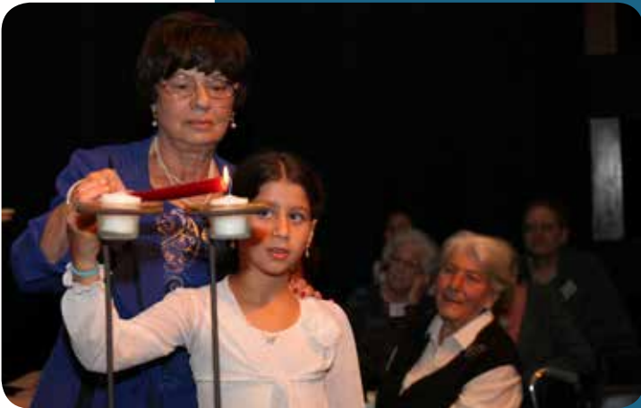
ביום השואה, שישה ניצולים מדליקים נרות זיכרון