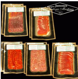
Lote Maragato: 2 sobres de 100 gr de cada producto (cecina, jamón, chorizo, salchichón y lomo) Precio: 20,02€