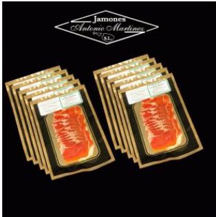
Lote Jamón Gran Reserva Premium: 10 sobres de 100 gr. Precio: 28,16€