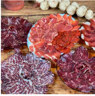
Lote degustación 9 sobres, Precio: 37,78€