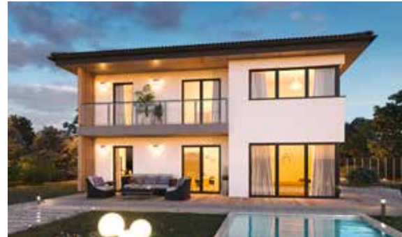
SCALA 128W MUSTERHAUS Graz