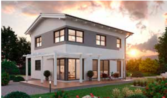
SCALA 126S MUSTERHAUS Eugendorf

Nichts gibt mehr Sicherheit: Sehe, teste und spüre die SCALA Haus Qualität in unseren Musterhäusern: