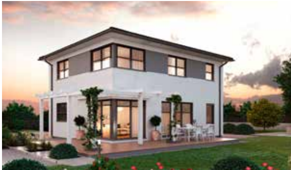
SCALA 126W MUSTERHAUS Haid