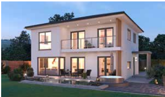
SCALA 136W MUSTERHAUS Blaue Lagune