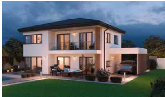
SCALA 137W MUSTERHAUS Haid ab Mitte Mai 2020