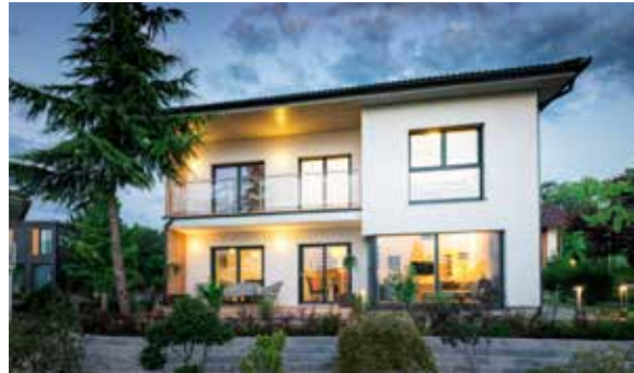
SCALA 144W MUSTERHAUS Eugendorf