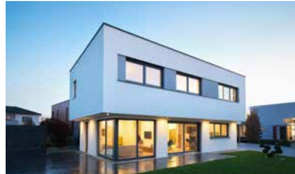
SCALA 160F MUSTERHAUS Haid