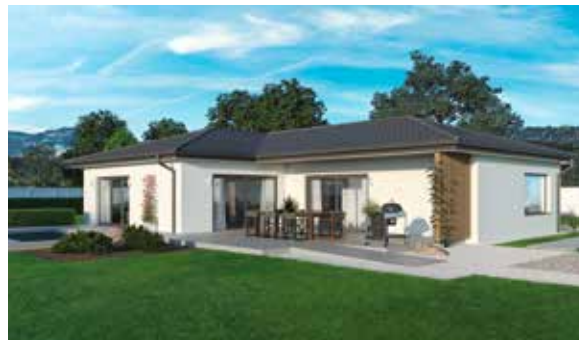
SCALA 135W MUSTERHAUS Blaue Lagune ab 27.03.2020

MUSTERHAUSPARK EUGENDORF Musterhauspark 23 5301 Eugendorf Tel.: +43 660 199 53 60 eugendorf@scalahaus.at