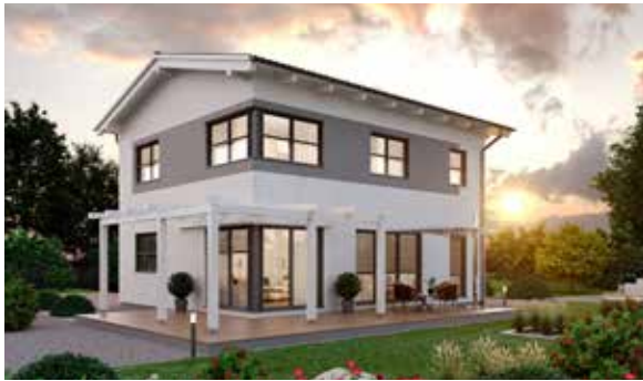
SCALA 126S MUSTERHAUS Eugendorf

Nichts gibt mehr Sicherheit: Sehe, teste und spüre die SCALA Haus Qualität in unseren Musterhäusern: