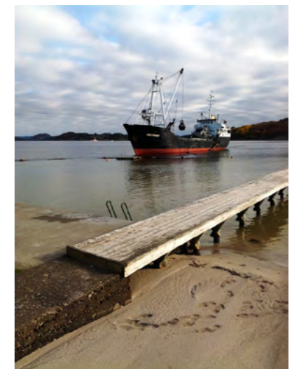
Skjellsand - Naudodden

På Naudodden er det over 150 interessenter, og vi sendte informasjon til alle både før og underveis i arbeidet. Vi hadde åpent informasjonsmøte på rådhuset i Farsund, og etablerte en byggekomite med representanter fra havnevesenet, politikerne og leietakerne. Det var 4 byggemøter i anleggsfasen. Arbeidene ble gjennomført på en god måte i samarbeid med entreprenøren AF Decom AS.