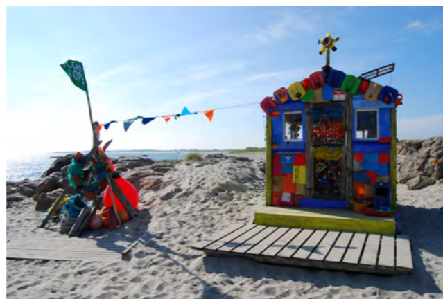
Ocean Hope.

Høydepunkter i 2012 har vært at delprosjekt «Miljøvennlig turisme» benyttet søppel fra den årlige ryddingen av Listastrendene til hyttebygging. Strandsøppelhytta Ocean Hope ble plassert i verne Havikaa for å formidle om skader på natur fra søppel i havet. Dette ble en av årets mest besøkte turist-attraksjoner i Lister.