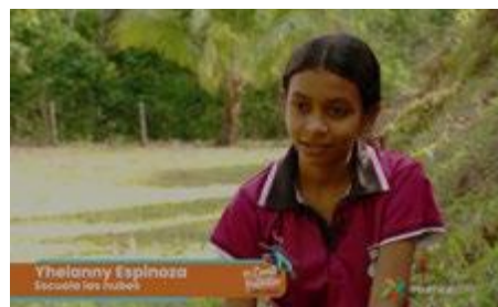
Canal 7 visitó la Escuela Las Nubes para entrevistar a las ganadoras del certamen.