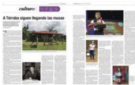
El Semanario Universidad destacó el impacto de Mi Cuento Fantástico en esta región.

Dedicamos la portada de este informe a la Escuela Las Nubes, en la región Grande de Térraba, como muestra del impacto de ADA en todo el país, incluso durante 2020, cuando la pandemia obligó a cerrar los centros educativos.