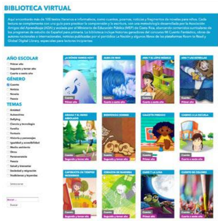
Los textos de la biblioteca se pueden descargar de manera gratuita. Todos están categorizados por género, tema y año escolar.

Durante el año 2021, ADA ampliará la biblioteca con otros 100 textos literarios e informativos, todos complementados con guías didácticas para que los docentes puedan trabajar la lectura, la comprensión y la escritura en el aula o “a distancia”. La metodología de estas guías ya fue desarrollada por el equipo pedagógico de ADA y avalada por el Ministerio de Educación Pública (MEP), en línea con los programas de estudio de Español de primer y segundo ciclos.