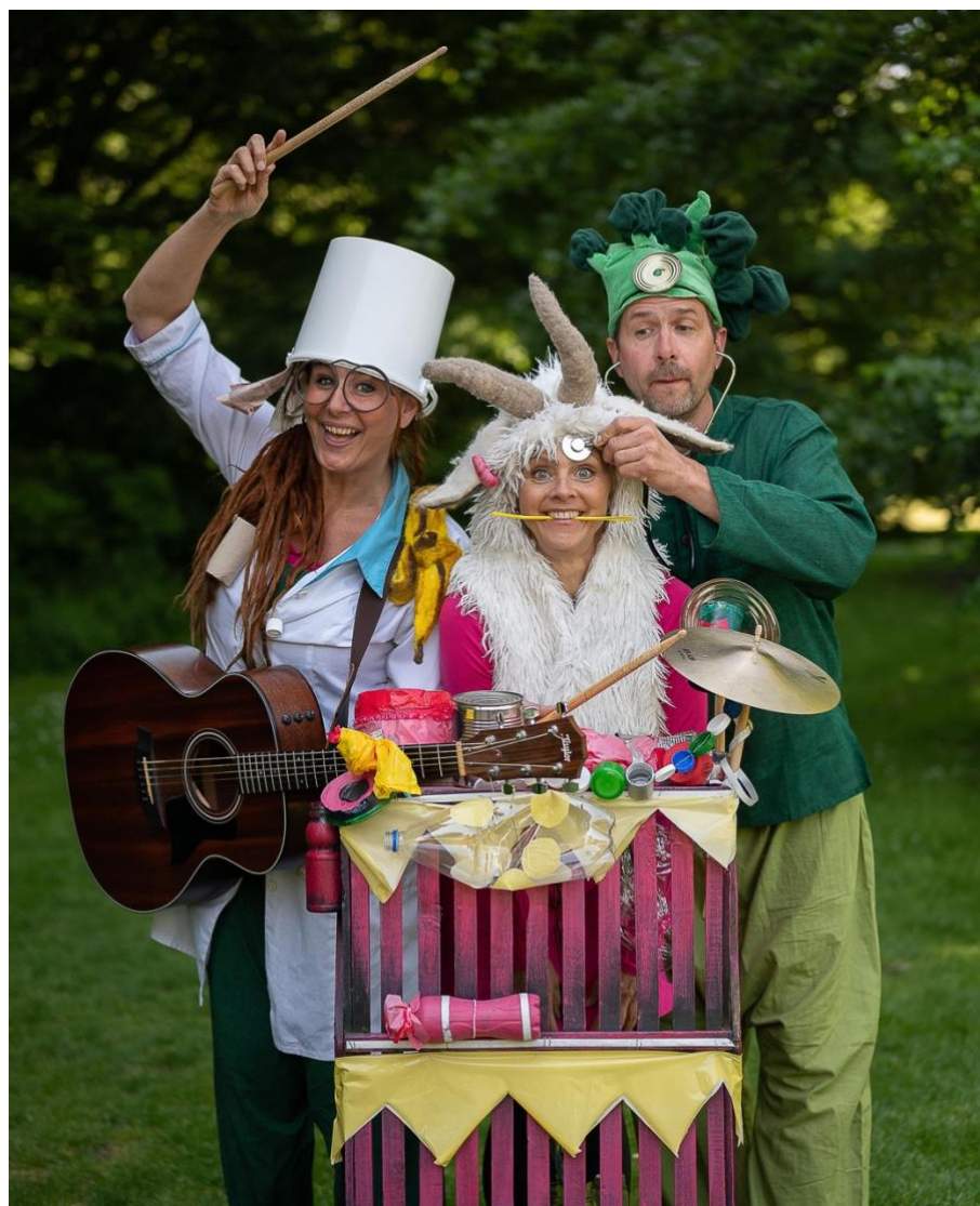
På bilden fr. v: Professor Skräp, Greta Get, Dr Broccoli