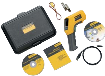
Fluke 568 ja mukana toimitettavat lisävarusteet