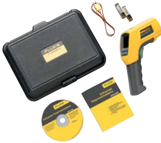
Fluke 566 ja mukana toimitettavat lisävarusteet