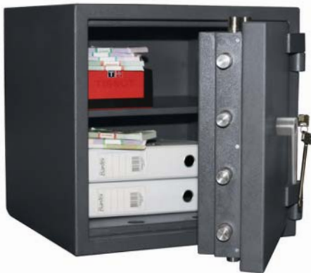
FORT M 50