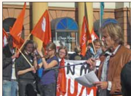
Demonstrasjon. Regjeringen bryter asylbarns rettigheter!

Alle velferdsordninger står under press i dag da fagbevegelsen ikke lenger er så sterk som for 50 år siden, men fagbevegelsen er den eneste motvekt til markedskreftene og må ta klar stilling – bare det