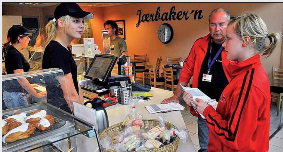
LO besøkte svært mange arbeidsplasser i sommer!

Sommerpatruljen er atter en gang over (for 23'dje gang). Her tenkte jeg å dele noen av minnene som bet seg ekstra godt fast hos meg.