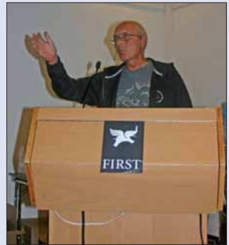
Fra Olje- og Anleggskonferansen.

Dette er noe av det du kan lese om i Samleskinnen: