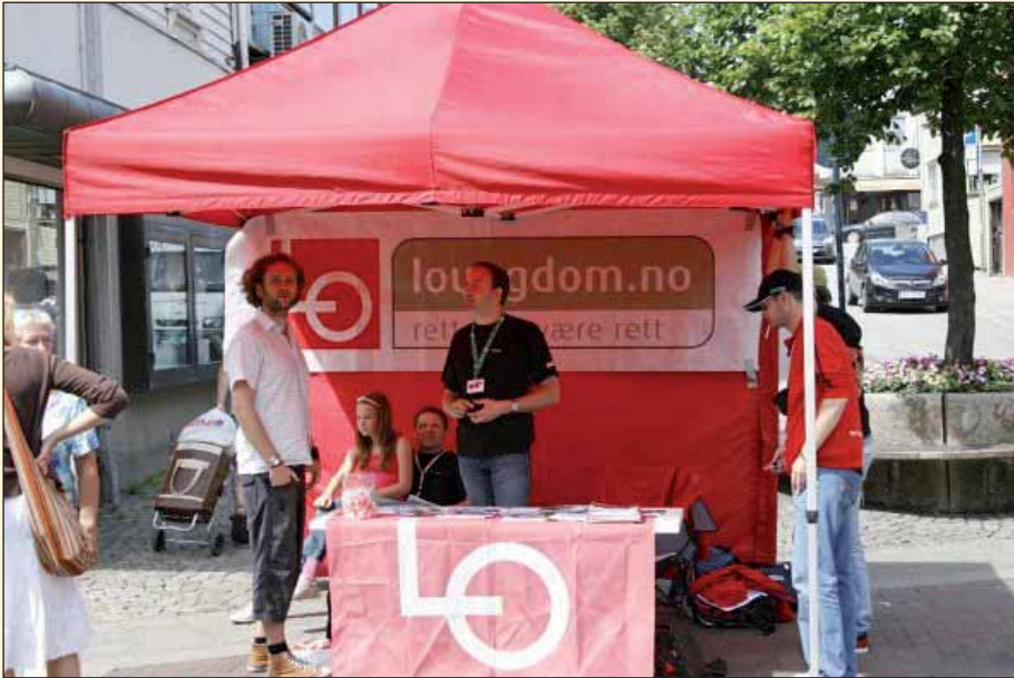
LO med sin paviljong fikk oppmerksomhet under årets sommerpatrulje.

at dette var noe vi gjorde flere ganger i året for det er enda rom for forbedringer hos mange arbeidsgivere.