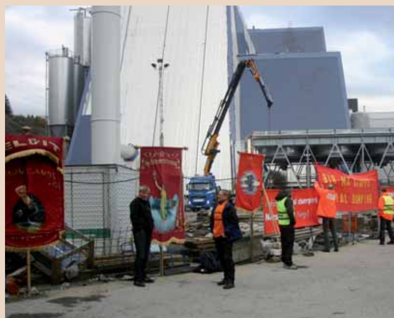
Øivind Wallentinsen og Leif-Egil Thorsen med fagforeningsfanen som fikk følge av over 16 andre fagforeningsfaner.