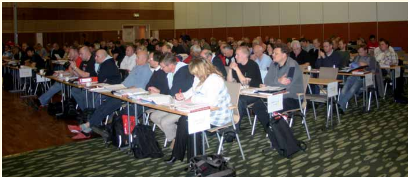
Landstariffkonferansen ble holdt på Clarion hotell i Stavanger.

arbeidsmarkedet er den største årsak til fattigdom”, kan vi forstå at lønnskrav alene ikke vil løse de problemer som vi står ovenfor. Det er også et faktum at styrkeforholdene mellom partene i arbeidslivet har større betydning for velstandsutviklingen enn hvem