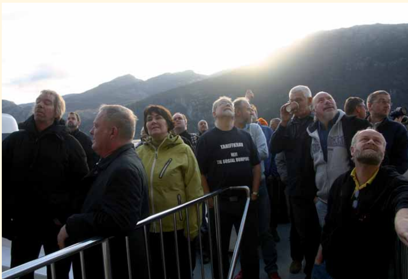
Fagforeningen inviterte delegatene på Landstariffkonferansen på tur i Lysefjorden og fikk se Preikestolen i nydelig vær.

som tar de politiske beslutningene. Styrken i EL & IT Forbundet er deg og meg. Dette er derfor viktig at vi samler våre krefter og tar denne kampen sammen nå!