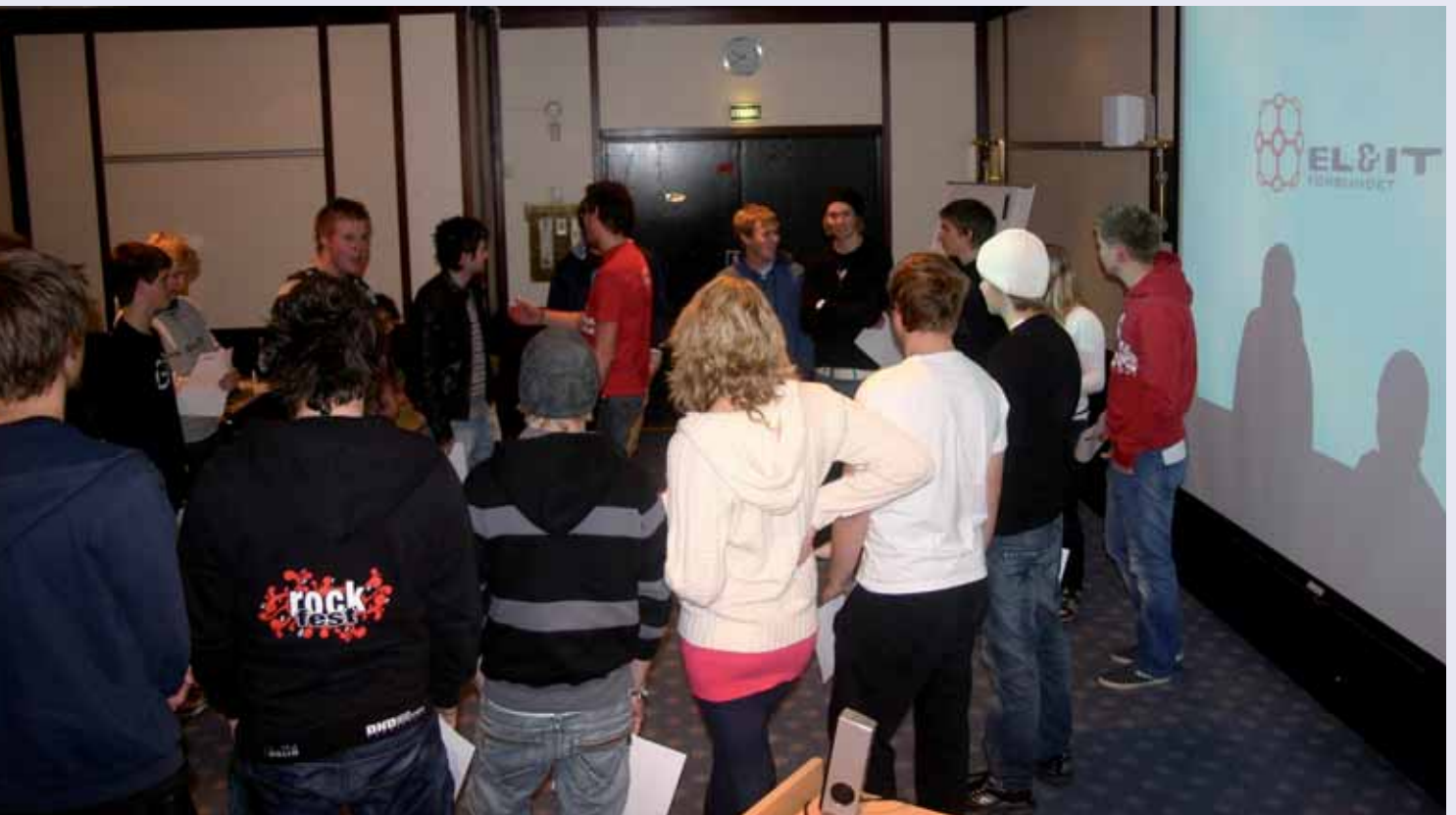
Bli kjent øvelse under ungdomskurset.