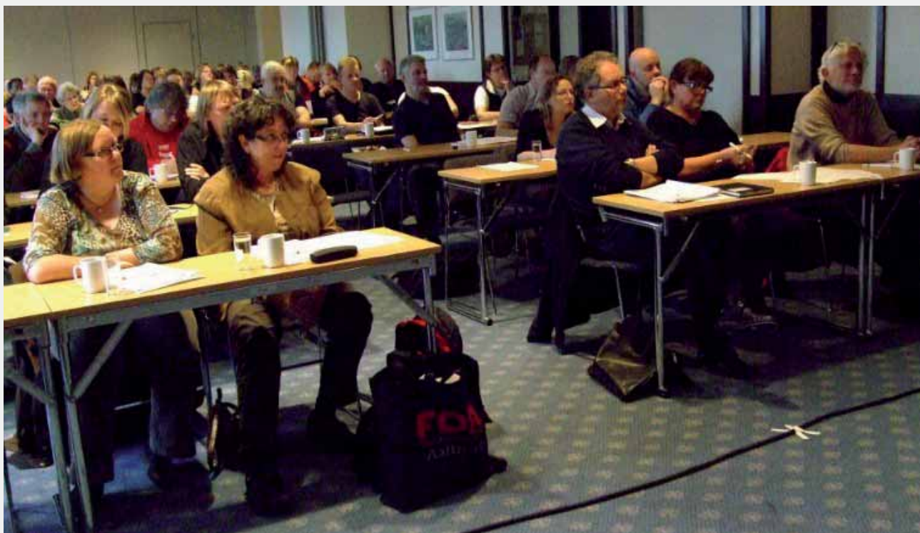
Deltakere på Rogalandskonferansen 2009.

II bør konkretiseres, utdypes og styrkes. Målet er at det skal skje i den kommende prosessen, der større deler av fagbevegelsen blir engasjert.