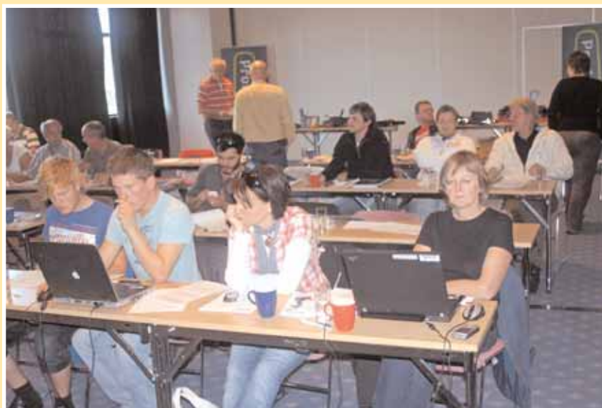
Noen av deltakerne under årets verneombudskonferanse.