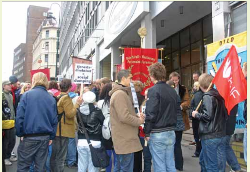
Noen av deltakerne på markeringen som hadde hatt plass til flere!