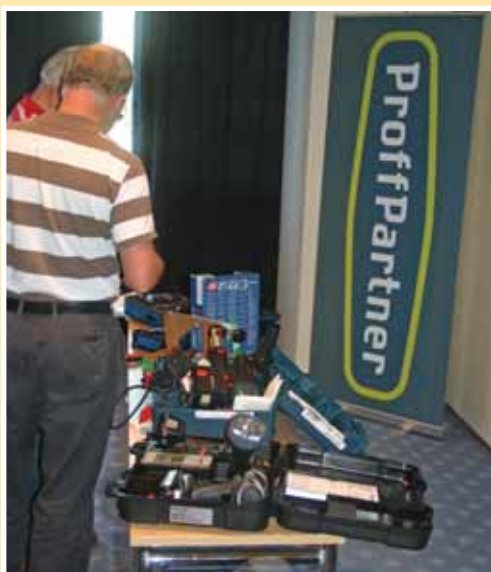
Proffpartner hadde med seg mye fint utstyr.

Det er ønskelig med innspill til tema og innledere på konferansen i 2009 og disse sendes distriktet Rogaland. Det ble forsøkt å få en diskusjon om kanskje det var en ide og ha to dagskonferanser, en på våren og en på høsten i stedet for todagens konferanse. Det kom ingen tydelige svar på dette men det kan også verneombudene og klubbene ta med seg i sine diskusjoner og gi tilbakemeldinger på!