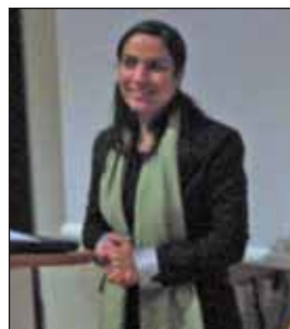
Malalai Joya har fått tilnavnet; verdens tøffeste kvinne for sitt engasjement i Afghanistan.

Hvor store overgrep er vi villige til å overse, for å tjene milliarder i korrupte og brutale land?