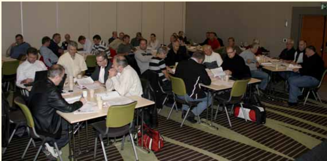
Gruppediskusjoner under konferansen.

”Alle var enige om at dette hadde vore ein gild tur, og at dette måtte dei gjera fleire gonger”