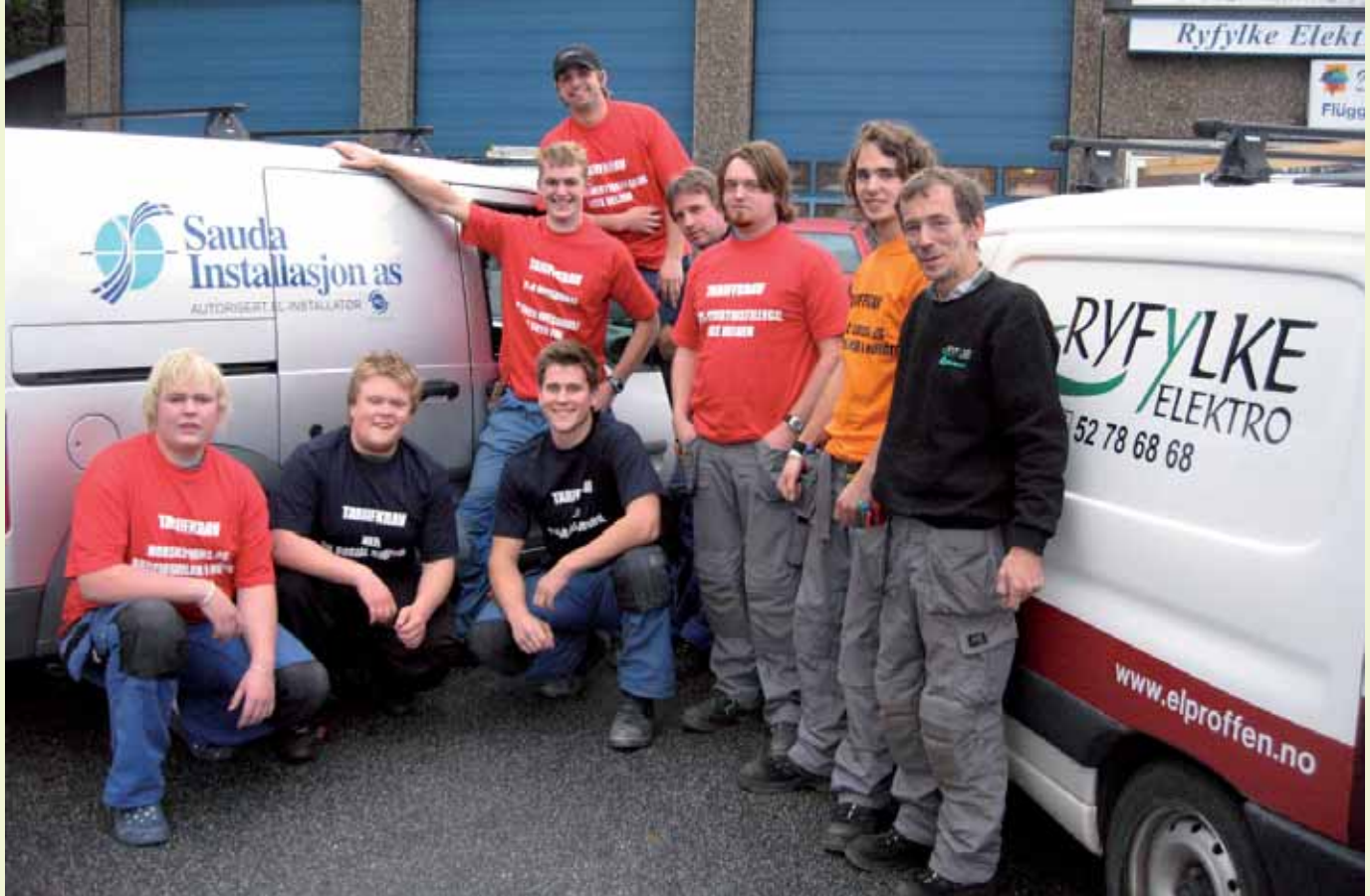
Lærlinger og tillitsvalgte fra møte i Saida hos Ryfylke Elektro. Medlemmer fra både Saida Installasjon og Ryfylke Elektro stilte i møtet.

Her var oppmøtet dårlig. Det var bare 4 lærlinger til stede. Det var 2 lærlinger fra