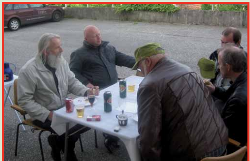
Medlemmer fra Lyse fant veien til Lagårdsveien.