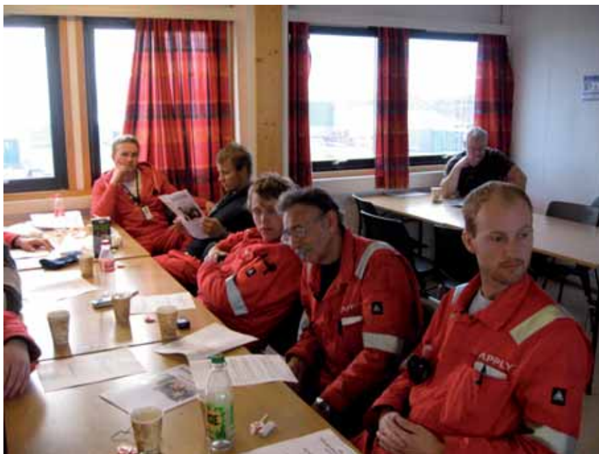
Fra spisebrakka til medlemmene i Apply.

Det kom et unisont krav om bedre arbeidstidsordninger.