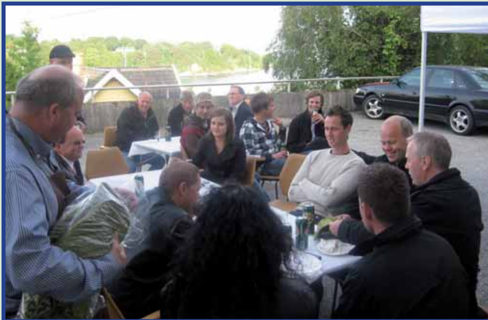
Ca. 40 medlemmer fant veien til distriktets sommerparty.