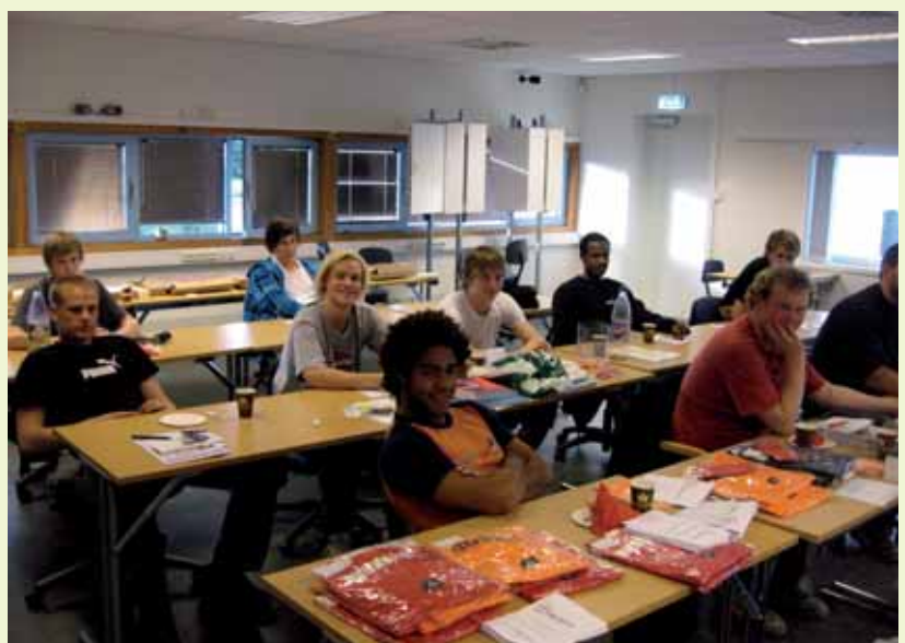
På møtene serverte fagforeningen pizza Fra møte i opplæringskontorets lokaler på Forus.

Fagforeningen sin T – skjorte ble utdelt. Det ble stor diskusjon rundt de krav som var på t – skjortene.