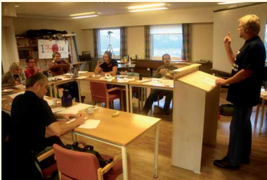
Aktive og flinke deltakere på kurs i tale og debatteknikk.

10 deltakere var med på distriktets kurs i tale og debatteknikk den 24 og 25. september.