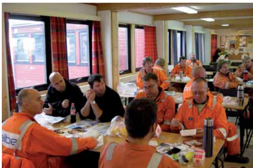
Fra spisebrakka til Aibel på Kårstø. Mange innleide på 4 - 3 ordning.