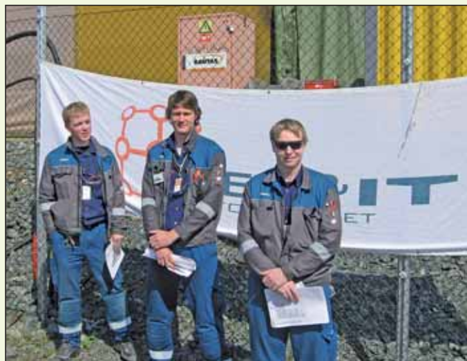
Utenfor Kårstø under aktivitetsuka.

Samleskinnen takker dere begge for intervjuet og ønsker lykke til videre på prosjektet.