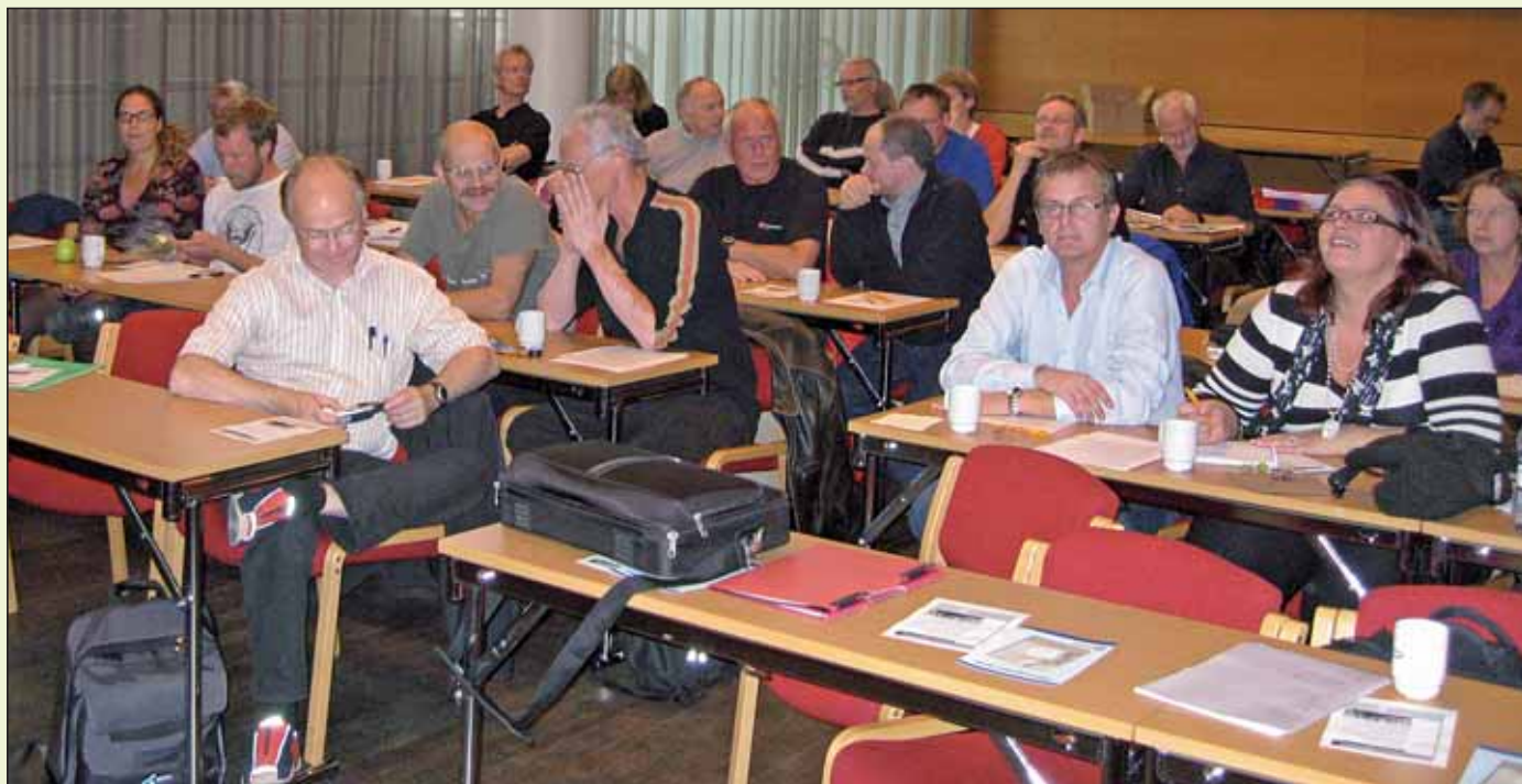
Deltakere på konferansen om sosial dumping.

Av Therese Anita Holmen og John Helge Kallevik