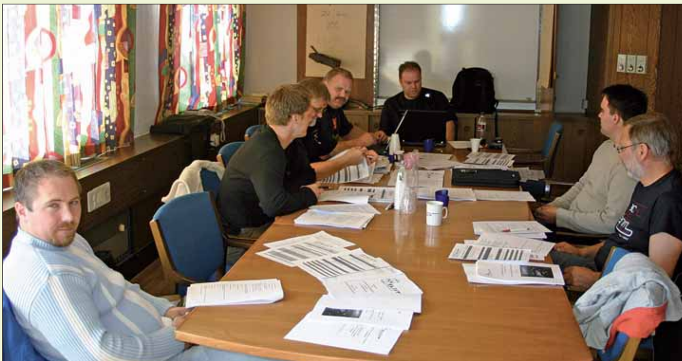
Installasjonsutvalget i arbeid med kravene til Landstariffkonferansen.

Mange av kravene til endringer i avtaleverket er utestående krav fra tidligere år og presisering av disse. Det er fokus på velferdsordninger som bør forbedres med tanke på bla permisjon med lønn ifm fødsler og den første tiden hjemme. Offshore er svært opptatt av å få lik rotasjonsordning som operatøransatte som går 2-4 rotasjon. Og reisepersonellet som må bo borte fra hjemmet ønsker bedre rotasjonsordninger og velferdsordninger på anlegget.