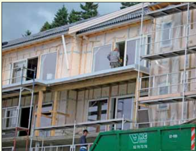
Stillas som ikke var forskriftsmessig.

Det var en fantastisk opplevelse. Vi fikk god kontakt med polakkene.