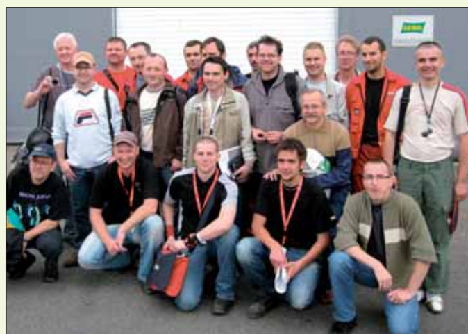
Deltakerne på årets sommerpatrulje.

Fagforeningen bestemte at vi i år, som tidligere år, skulle delta i årets Sommerpatrulje. LOs sommerpatrulje avholdes over hele landet, i Rogaland fra 2. – 6. juli. Fagforeningen stilte med 8 medlemmer på LOs Sommerpatrulje 2007. De fordelte seg på 2 fra styret, 3 fra Aibel Klubben og 1 fra Aker Kværner Klubben. I tillegg stilte våre to organisasjonssekretærer.