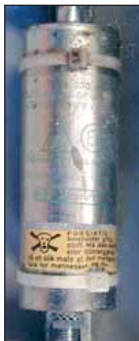
Kondensator med PCB innhold.

Biomagnifikasjon: PCB vandrer gjennom næringskjeden, ved at rovdyret «samlar opp» PCB innholdet fra byttedyrene sine. Selen får derfor høyere konsentrasjoner enn fisken den spiser. Inntak av animalsk fett kombinert med lang levetid (som hos mennesker og isbjørn) gir mulighet for oppkonsentrering av PCB.