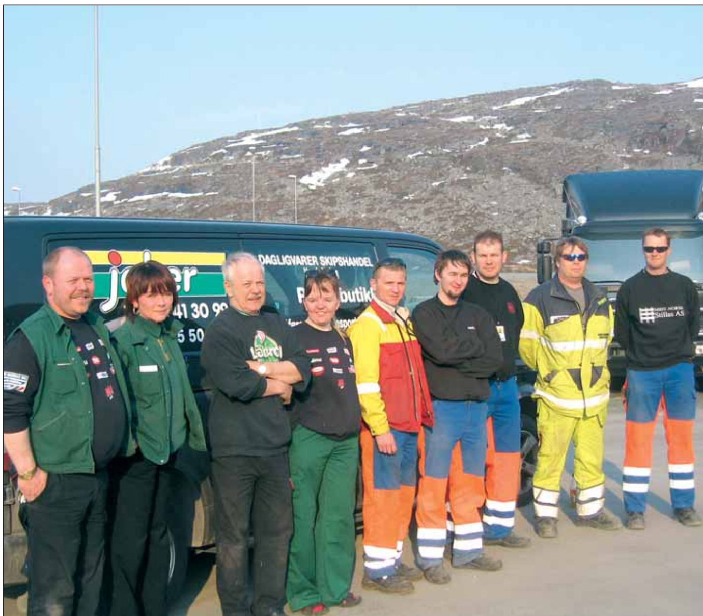
Innlevering av flasker på Melkøya hjelper barn i Polen.

Med vennlig hilsen Verneombudene på Melkøya Aker Kværner kontrakten V/KHVO på Melkøya for Aker Kværner Stord