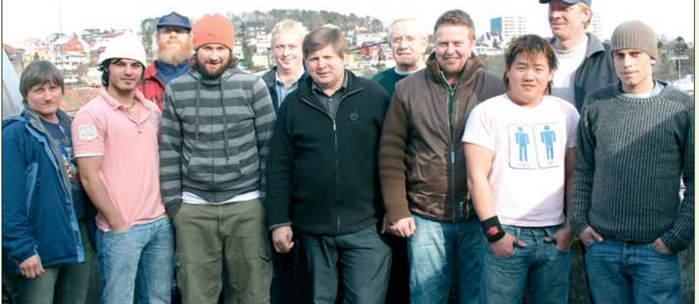
Deltakere på tillitsmannskurset.

Ja, jeg kunne tenkt meg å melde meg på et videregående kurs. Da gjerne med utdyping i enkelte ting.