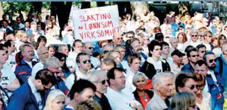
Fra demonstrasjonen for videre drift av SAS Braathens verksted.