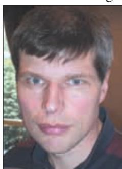
Lederen har Ordet

Her er det viktige og velbergrunna krav som knytter seg til disse prioriteringene. Jeg skal begrense meg til å kommentere 2 av kravene. Tariffesta tjenestepensjon er ett krav som er kommet gjennom at folketrygden gradvis er blitt svekket opp gjennom årene og ikke minst resultatet av det arbeidet pensjonskomisjonen levert nå i januar. Vi har vedtak i forhold til at vi skal ha en tjenestepensjon på linje med det de har i offentlig sektor altså en ytelsesbasert bruttopensjon på 66%. Jeg mener at skal vi først kreve tjenestepensjon må den være ytelsesbasert. Det er etter min mening altfor mange negative sider med innskudds pensjons som er den andre varianten. Innskuddsbasert pensjon har en øvre grense i forhold til hvor høy premie bedriften ha lov og betale, samtidig er den frikopla folketrygden slik at den i sum ikke gir en eller annen garantert pensjon. Ytelsesbasert ordning er den beste etter min mening først og fremst pga. at du har en "garantert" pensjon når du blir pensjonist. En ytelsesbasert ordning vil også være forebyggende i forhold til ytterlige reduksjoner i folketrygdens ytelser.