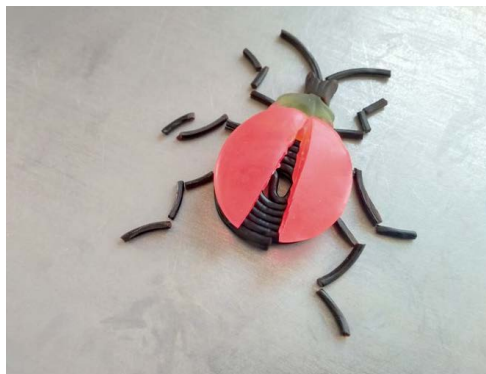
Door Stefan Tingen, lesgroep 1.3