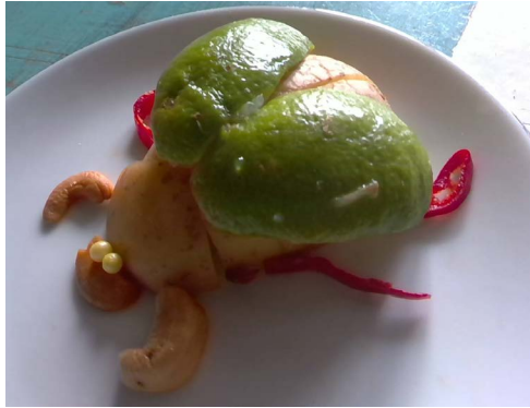
Door Loet Rosmalen, lesgroep 2

Er wordt in de leerjaren 1 t/m 4 hard gewerkt aan diverse online opdrachten voor het vak beeldend. Op de afbeeldingen twee 'snoepkevers': ware kunstwerken. En heel erg lekker ;-)