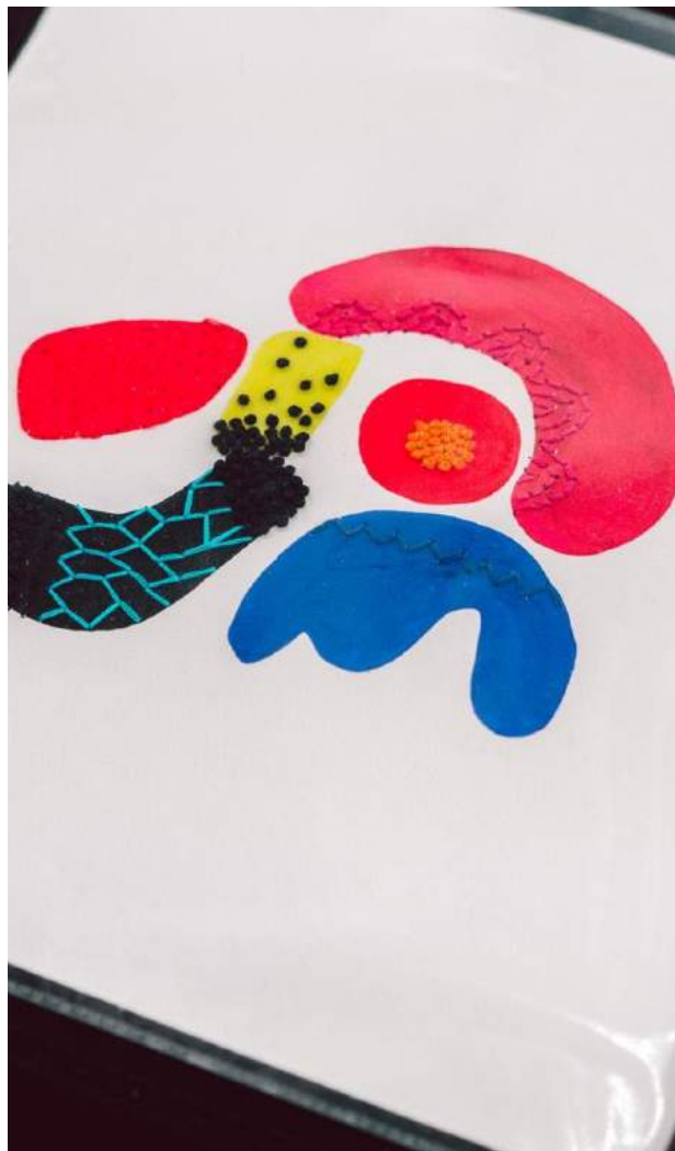
Lamas (série Peru) 2017 gouache et fil brodé sur papier (FAC 2017, 2018)

notre volonté: permettre aux amoureux des arts de profiter d'une vitrine exceptionnelle.