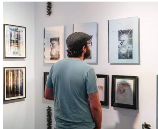
Œuvres d'Étienne Tremblay-Tardif, 2017