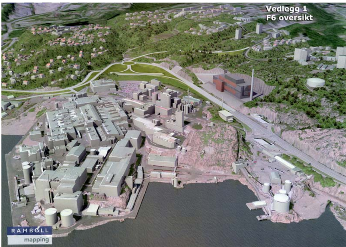
Slik presenterer Rambøll alternativ F6