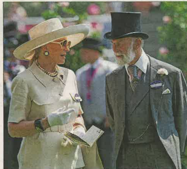
Prinssi saapuu Suomeen ilman vaimoan, Kentin prinsessa Marie Christina, sillä nyt vierailulla pyritään edistämään maamme välistä kaupankäyntiä.